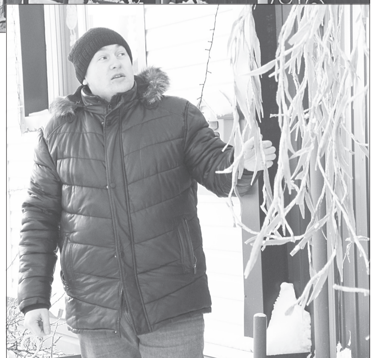
К следующей зиме Александр хочет доработать инсталляцию в виде пальмы, чтобы светились и ветви, и ствол