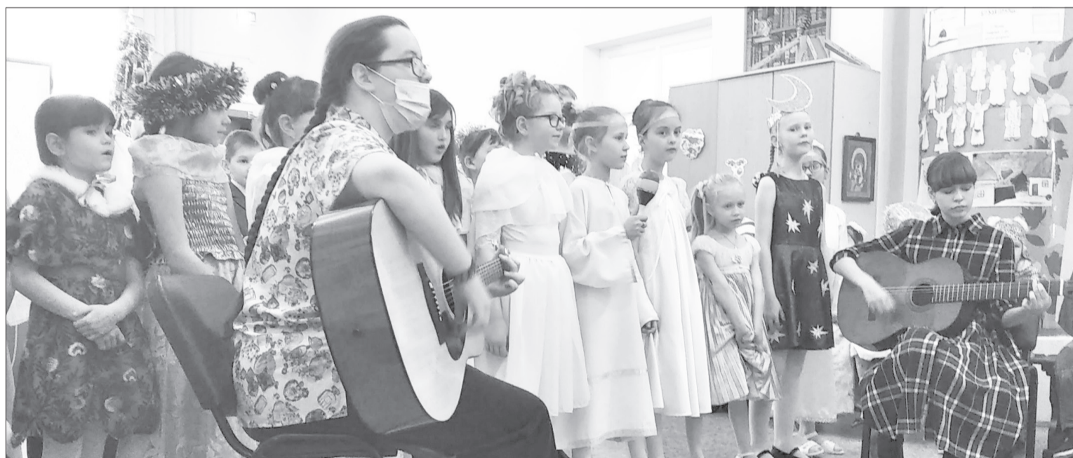
Детский хор впервые исполнил рождественские песни под гитару

зии четыре класса, в которых учатся 66 детей. Здесь светское начальное образование по федеральным стандартам с дополнительным изучением православной культуры и ценностей. Рождественская ёлка с Вифлеемской звездой, Дед Мороз и Снегурочка, подарки детям – всё это относится к средневековой исторической традиции, адаптированной к российским широтам. Ну а в основе, конечно, – евангельские свидетельства о рождении Христа и поклонении волхвов с дарами младенцу.