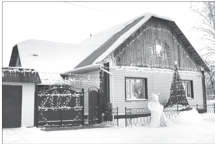
Каждый вечер на ул. Бахтиярова «зажигается» настоящая сказка