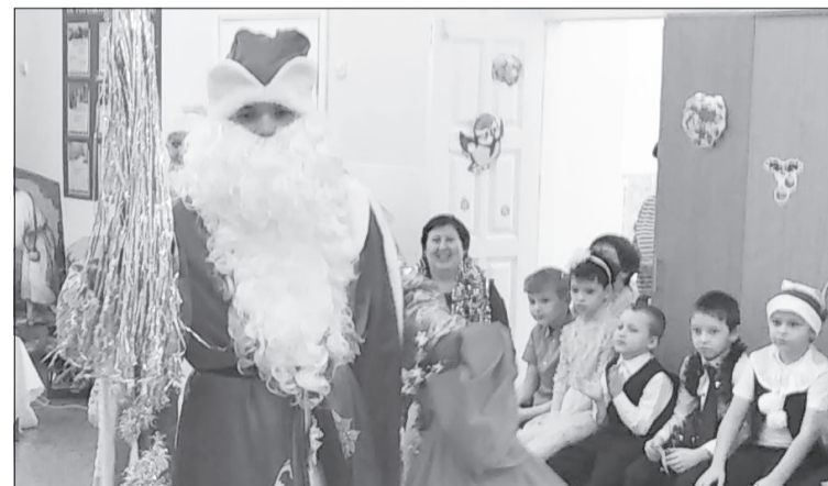
Деда Мороза дети ждали больше всего