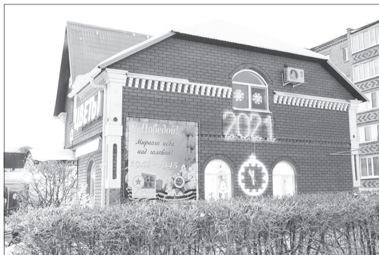
Многие предприниматели украсили свои здания к празднику