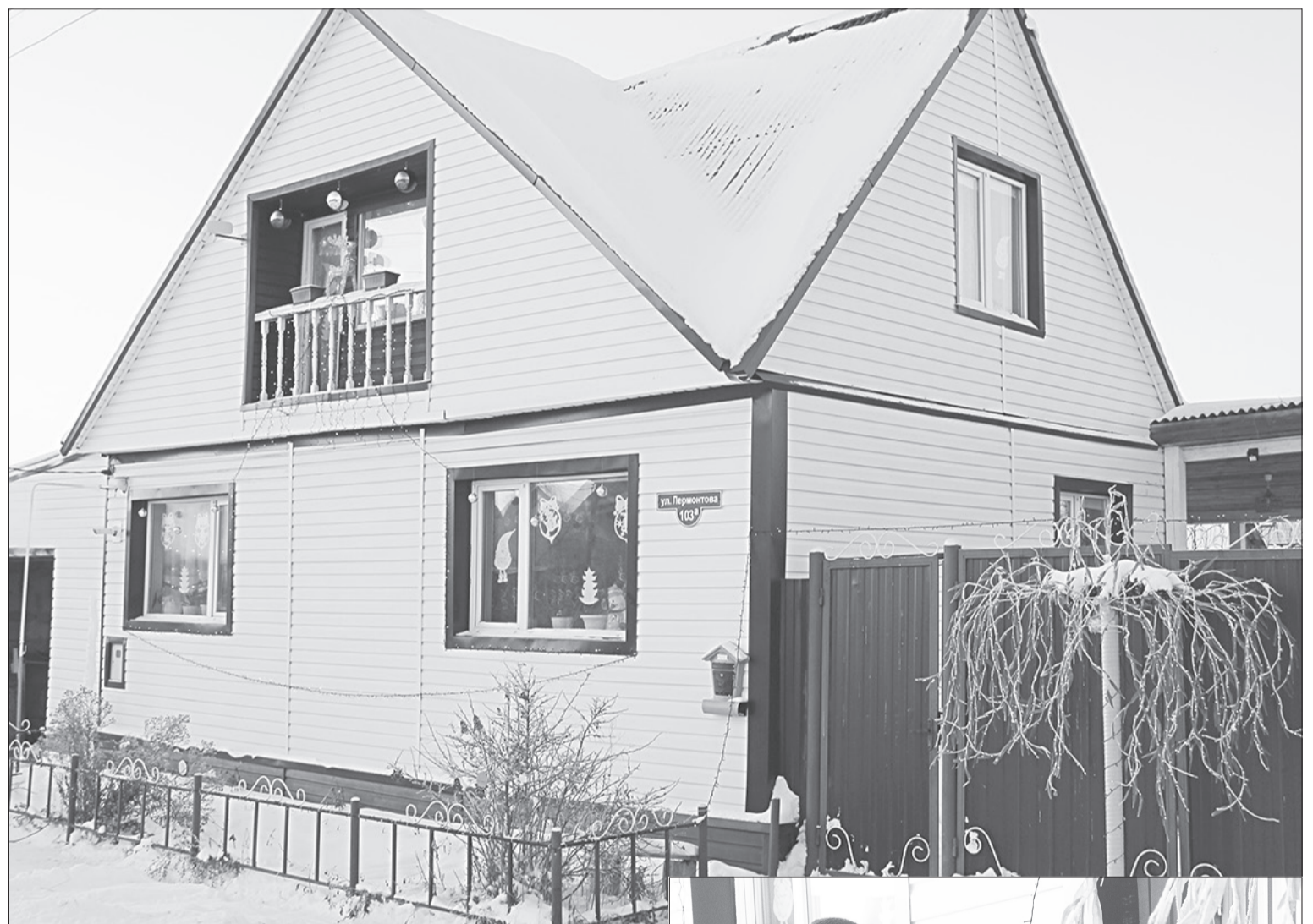
Ночью фасад дома семьи Степановых служит экраном для проектора, установленного перед палисадником

Победителей главного новогоднего состязания выберут ялуторовчане