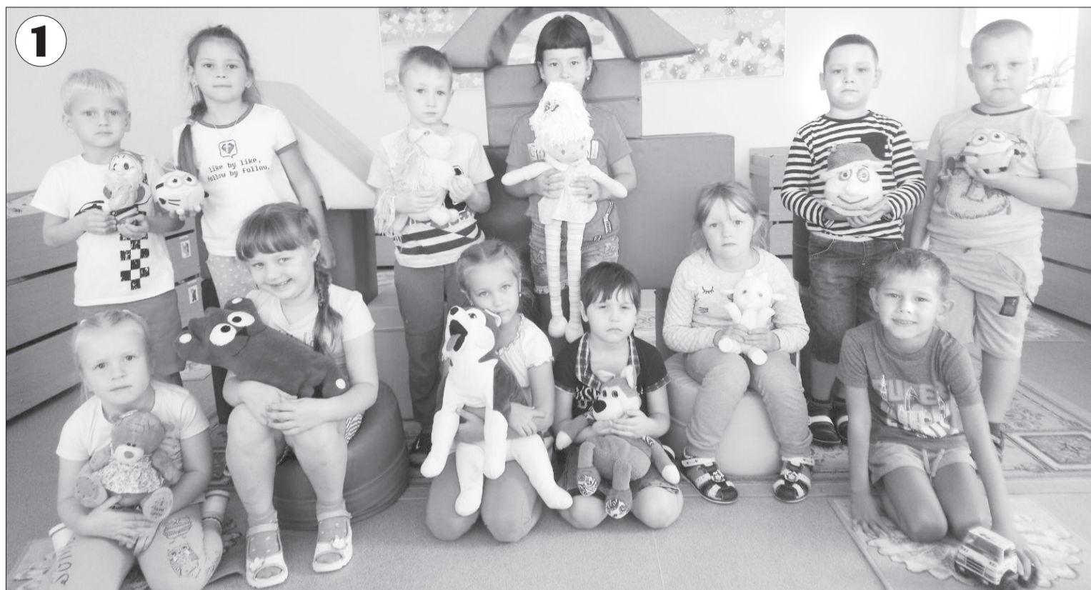
1 К флешмобу присоединились ребята из подготовительной группы «Умники и умницы» ялуторовского детского сада № 10. О каждой из своих игрушек они прислали подробные рассказы.

Авторы лучших работ получают сладкие призы.