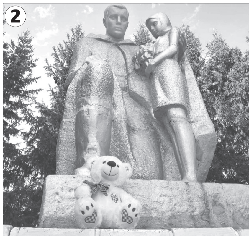
2 Родители трёхлетней Яны Сафаровой сфотографировали её любимца - плюшевого мишку Дружочка на фоне монумента, который был установлен в деревне Яр в 1975 году. Он посвящен памяти павших на войне жителей села.