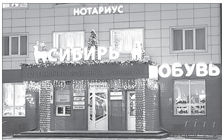
Отсутствие лампочек на правой колонне у входа в гостиницу - дело рук вандалов