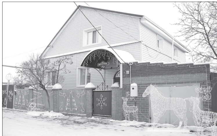
Частый герой фотографий ялutorовчан - дом на улице Мичурина

На этот раз итоги «Огней Ялutorовска» подведут по новому. Когда жюри осмотрит работы всех участников, в соцсетях объявят народное голосование, результаты которого учтут при выборе победителей.