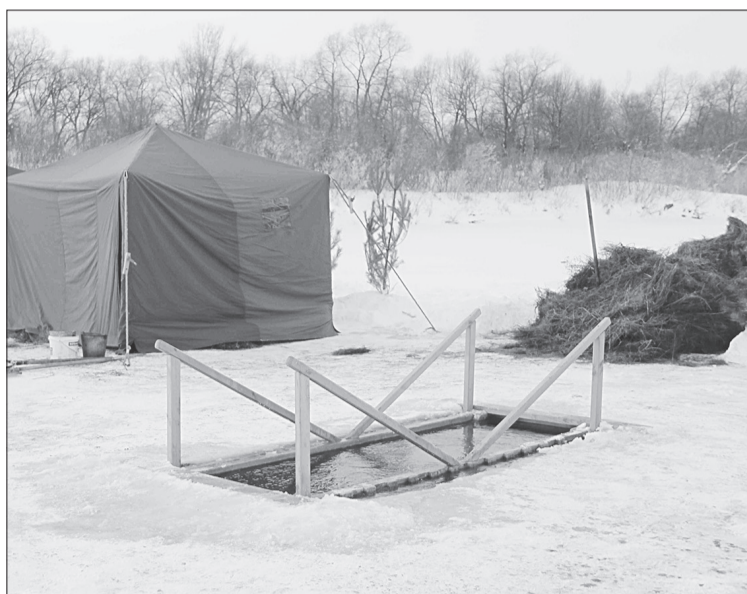
В Ялуторовске купели организуют на прежнем месте. Подъехать к ним можно с улицы Якушкина

Престольный праздник. В Заводопетровском 19 января – престольный праздник храма во имя Богоявления Господня. Это ещё одно правильное название дня Крещения, связанное с евангельскими событиями на реке Иордан. Отсюда, кстати, и наименование проруби в виде креста, из которой верующие берут воду. Литургию