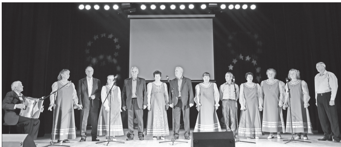
Ансамбль «Березки» (Черноковская ветеранская организация)

23 октября в рамках закрытия акции «Пусть осень жизни будет золотой» на базе Вагайского Дворца культуры прошла встреча активистов ветеранского движения.