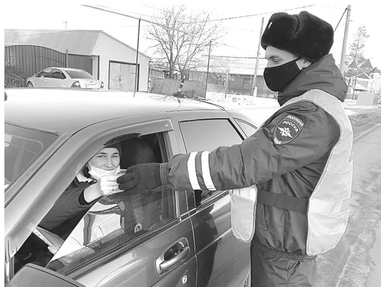
После блиц-экзамена в рамках акции инспекторы ГИБДД вручили водителям листовки по безопасности дорожного движения и брелки

– Мы предлагали водителям проверить себя, повторить пра-