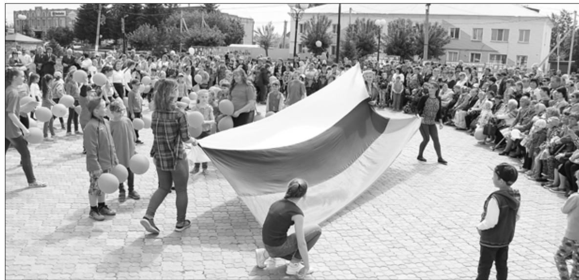
В День России площадь в посёлке Голышманово стала центром притяжения для всех