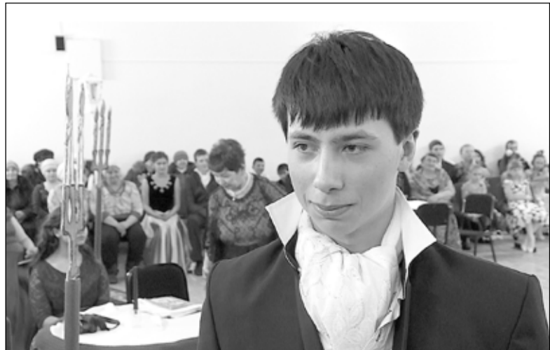
Яну Чернату по душе пришёлся Пушкинский бал – праздник юности и красоты

Елена ЛЕДАКОВА.