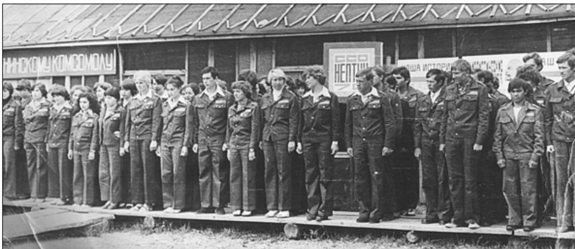
Торжественное построение студотрядов в день открытия сезона