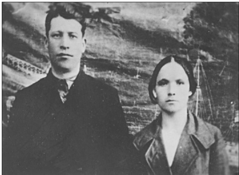
Единственное фото молодых родителей бережно хранится в семейном архиве дочери