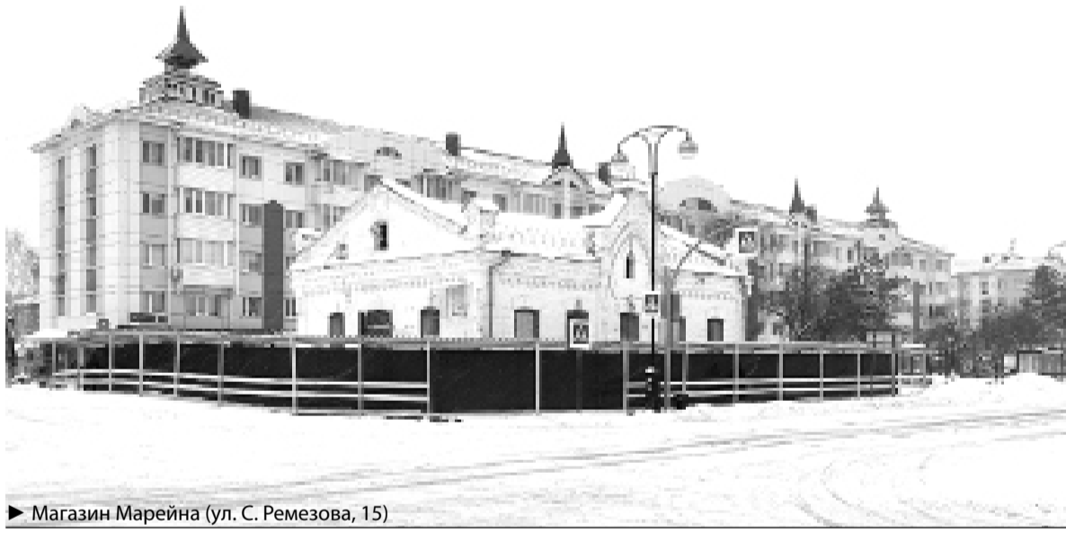
► Магазин Марейна (ул. С. Ремезова, 15)