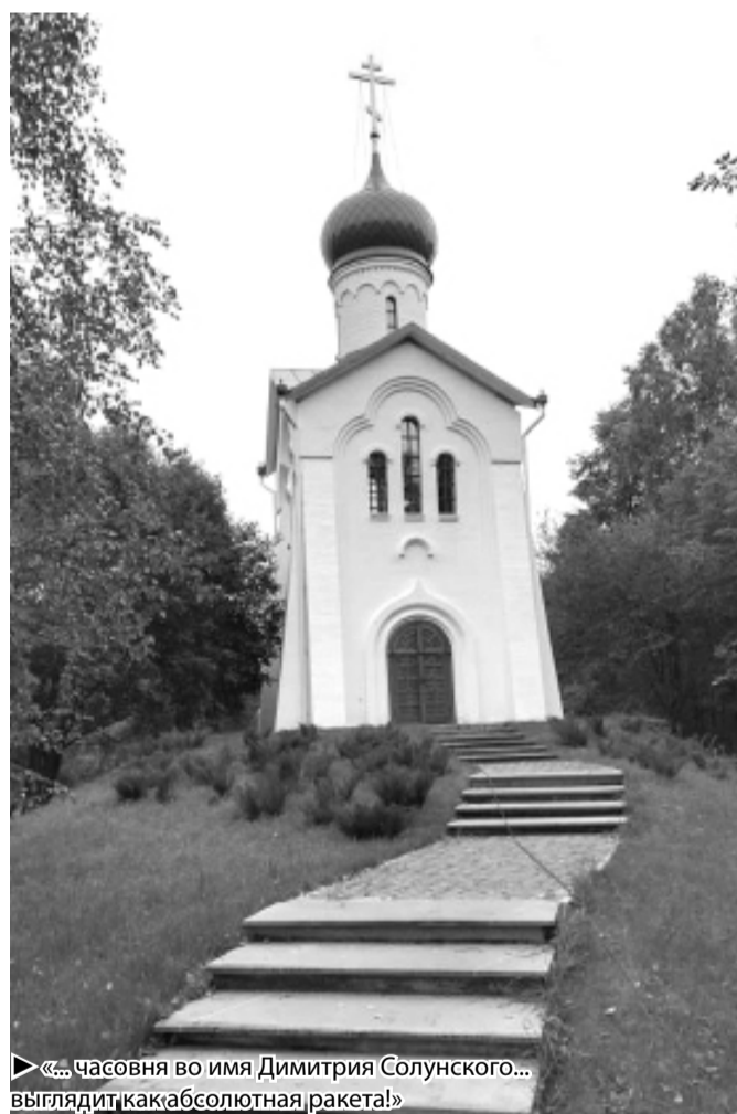
«... часовня во имя Дмитрия Солунского... выглядит как абсолютная ракета!»