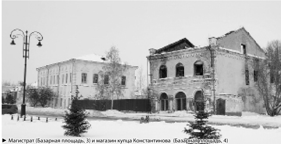
► Магистрат (Базарная площадь, 3) и магазин купца Константинова (Базарная площадь, 4)

В 2023 году по многим ОКН началась разработка (или идёт до-работка) научно-проектной документации на проведение ремонтно-реставрационных работ, таких как новый Гостиный двор (Базарная площадь, 11), здание девичье-приходского училища (Мира, 2), дом купца Неводчикова (Хохрякова, 10), земляной вал, дом Кремлёва (Хохрякова, 2), ограда и две сторожки ансамбля казённых винных складов (биофабрика), магазин купца Голева-Лебедева