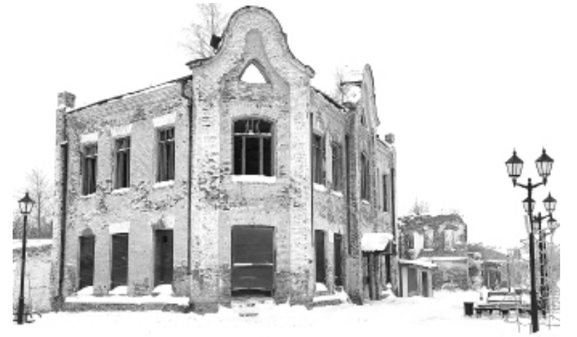
► «Детский мир» (ул. Мира, 1)

Директор департамента экономики города рассказала, ка-