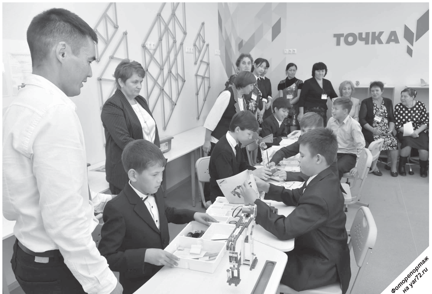
Центр «Точка роста» – площадка для развития современных навыков у школьников