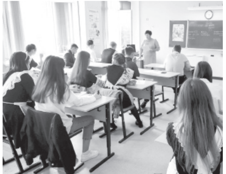
|| Фото из архива отдела образования

Федеральные победители будут награждены памятно-