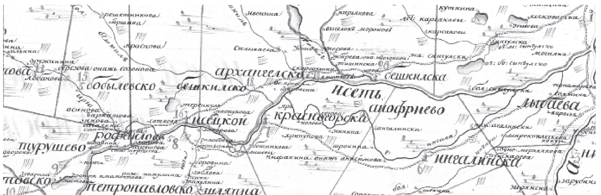
Фрагмент карты Ялutorовского уезда Тобольской губернии 1784 года.

А вы как на это смотрите? Давайте подумаем все вместе. Какие у вас есть задумки по историко-краеведческим поискам?