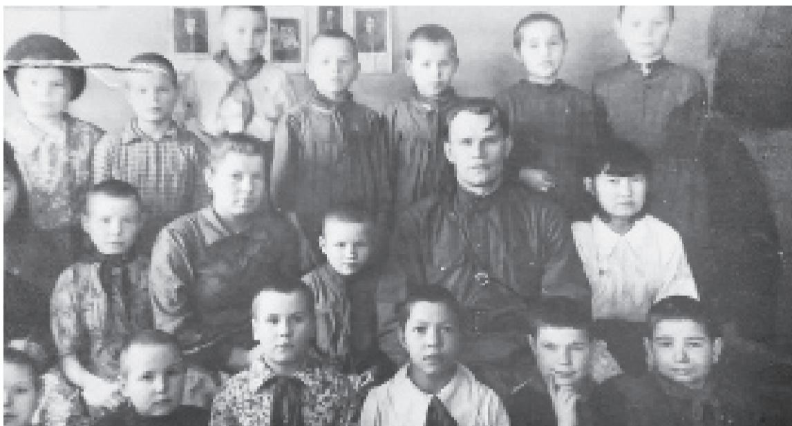
Дети из блокадного Ленинграда, 1940-е годы.