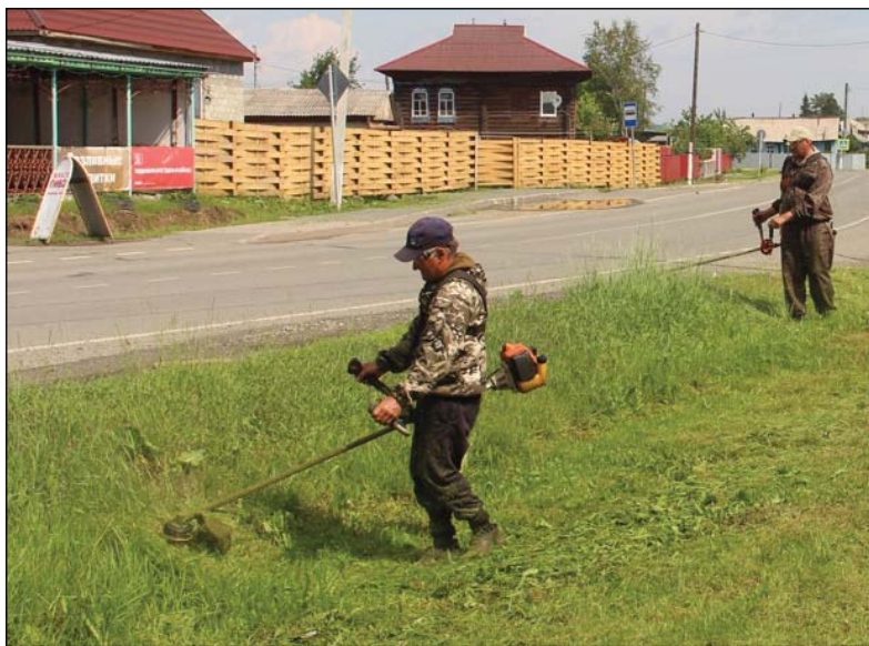
• Там, где проходит бригада косарей, улицы выглядят уютнее.

Ежедневная работа бригады преобразует эстетический вид села, но в формировании его привлекательности должны принимать участие и жители. Для этого распоряжением администрации Аромашевского района разработано положение о проведении конкурса на территории Аромашевского сельского поселения по благоустройству, озеленению придомовой территории и палисадников среди жильцов и собственников индивидуальных жилых домов, многоквартирных домов и подведомственных территорий среди предприятий, учреждений и организаций. Награждение победителей состоится на праздновании Дня села Аромашево 27 августа.