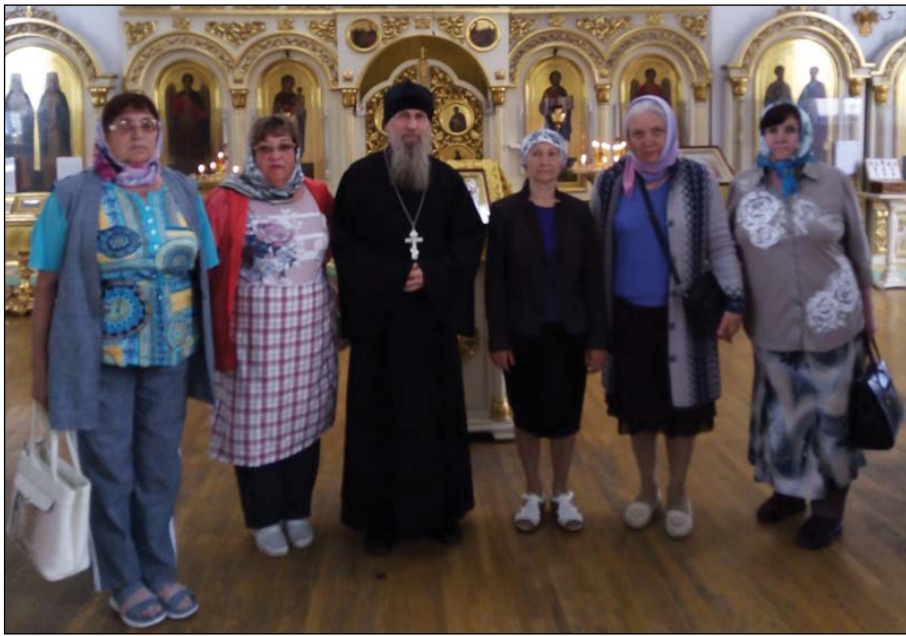
• Погрузились в красоту убранства тюменских храмов.

И вот наша группа перед Свято-Троицким мужским монастырём. Воочию убедились, что очень живописное место было выбрано для его строительства: на высоком берегу реки Туры, где взору открывается красивейшая панорама. Мы узнали, что изначально он был построен в деревянном исполнении, позже возведён в камне, являлся первым каменным монастырём