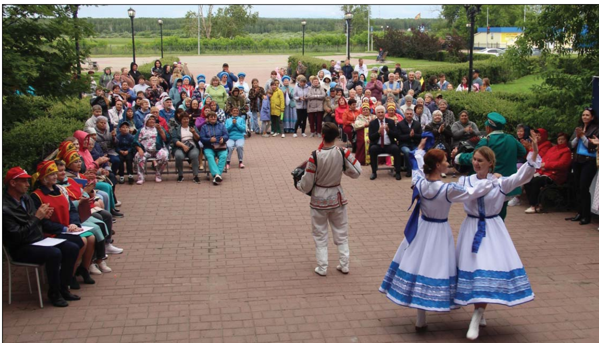
• Работники культуры вместе с гармонистами поднимали настроение публики.

– Мне приятно видеть здесь тех людей, чья молодость прошла под гармошку. Если спросить у ветеранов, то они скажут что «первый парень на деревне» в то время, конечно же, был гармонист. Независимо от того, какой тяжёлый был день, если за