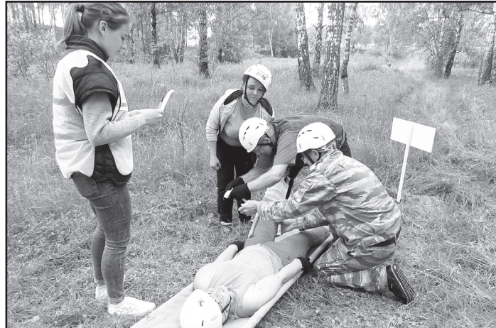
Районный туристический слёт