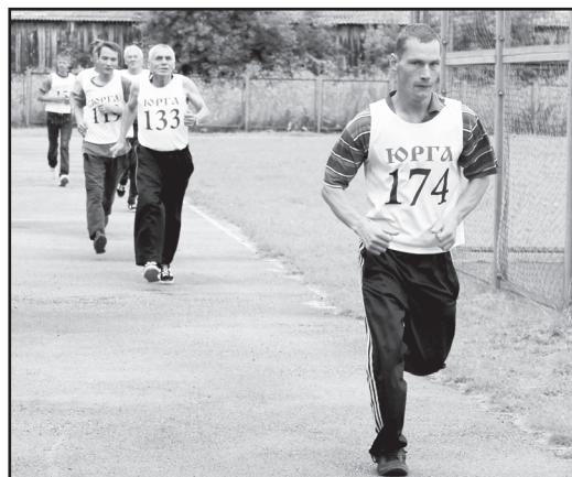
После прохождения всех испытаний комплекса ГТО два человека выполнили нормативы на золотой знак отличия, шесть – на серебряный, три – на бронзовый