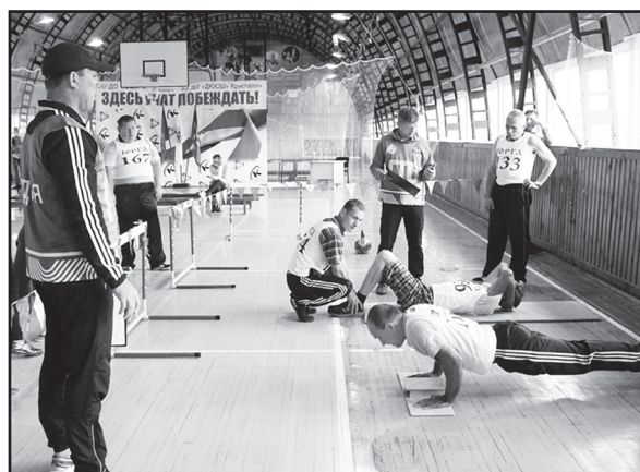
Специалисты Центра тестирования готовы оказать любую помощь