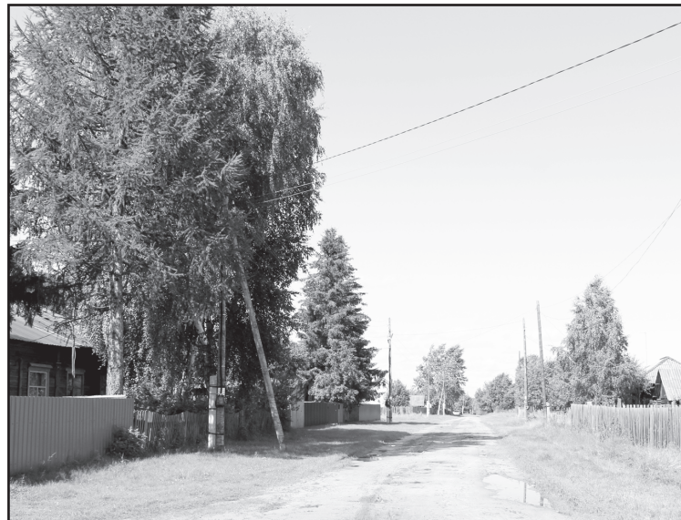
Новотоповская территория достаточно своеобразная. Лесная, таёжная

Татьяна УСОЛЬЦЕВА