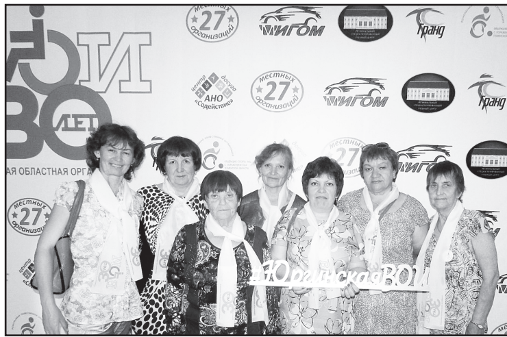
Представители Юргинской районной организации ВОИ – активные участники областных мероприятий

– Первый наш проект был создан для детей с инвалидностью. Одобрение на его реализацию получили от департамента физической культуры, спорта и дополнительного образования Тюменской области. В прошлом году с целью занятости инвалидов удалось выиграть Президентский грант: денежные средства пошли на закупку настольных спортивных игр, которые пользуются большим спросом у населения. Защитили в этом году проект по организации спортивного праздника, получили из местного бюджета значимую поддержку на его проведение. В