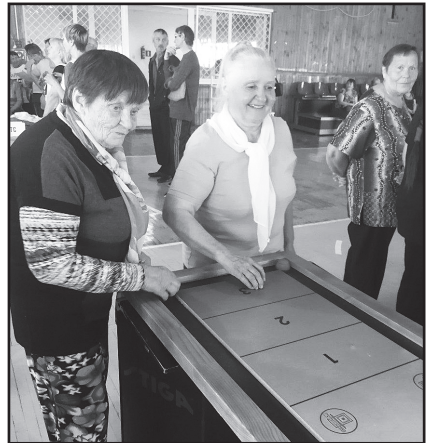
Участники спартакиады «50+» включились в реализацию проекта «Новус в Юргинском»

Галина КОРОЛЬ