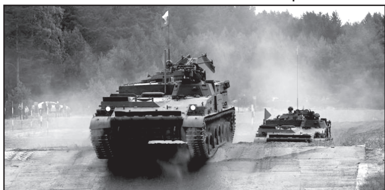
Финал V международных армейских игр «АрМИ-2019» в номинации «Инженерная формула»