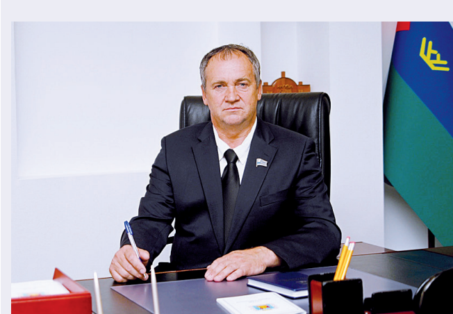
Андрей Ходосевич проведёт личный приём жителей в микрорайоне Южном.

Подводя итоги работы, председатель городской думы Андрей Ходосевич уточнил, что инженерные сети города разрастаются, а также проходят своевременный капитальный ремонт, и это позволяет надеяться, что и новый отопительный сезон в Тобольске пройдёт без аварий.