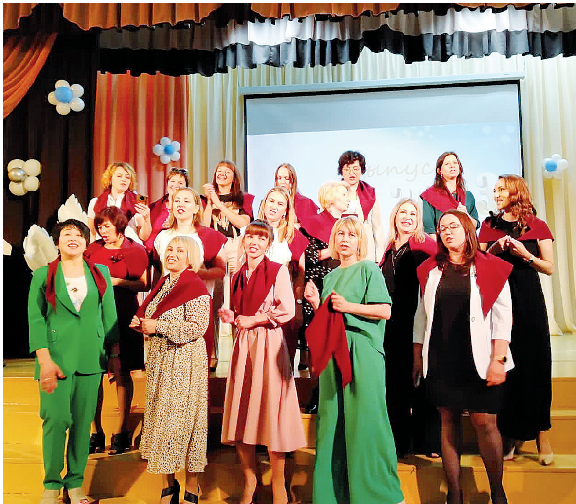
► Поздравление от родителей

«Очень важно, чтобы дело, которому вы будете служить, было по призванию и по душе. Дерзайте, верьте в себя, пусть вам всегда сопутствует удача