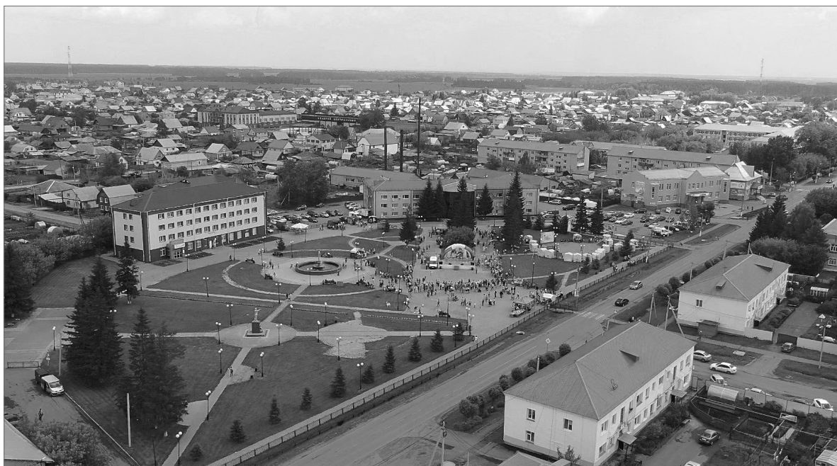
Планы строительства шестидесятых годов – в современном облике посёлка

По генеральному плану, значительно изменится центр посёлка. Улица Советская возле поселкового совета будет пере-