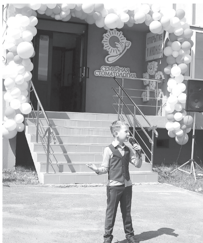
► Очередной инвестпроект – «Семейная стоматология»