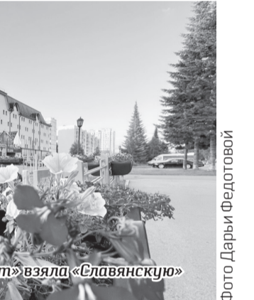
► Гостиничная сеть «Азимут» взяла «Славянскую» под своё крыло