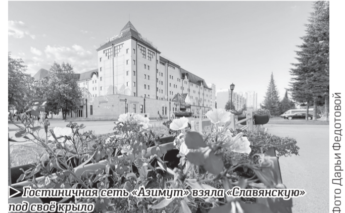
► Гостиничная сеть «Азимут» взяла «Славянскую» под своё крыло

– Как говорит наш губернатор Александр Викторович Моор, на одной ноге стоять можно, но на двух – лучше.