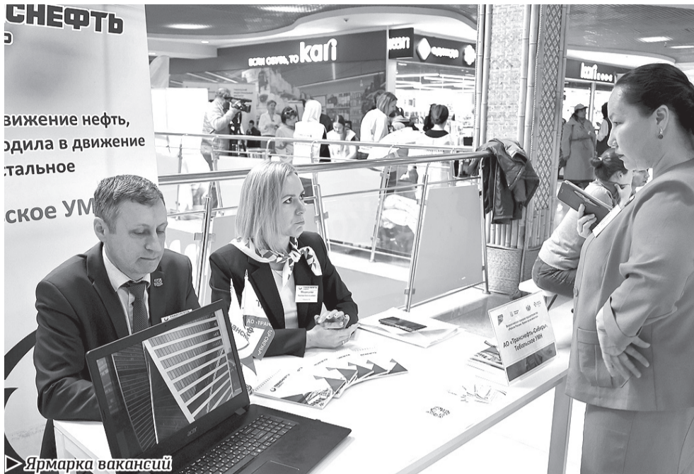
► Ярмарка вакансий

Традиционно в ходе последнего в этой сессии заседания Тобольской городской думы глава города отчитался перед депутатами о результатах работы городской администрации за прошедший год. И начал с экономических показателей