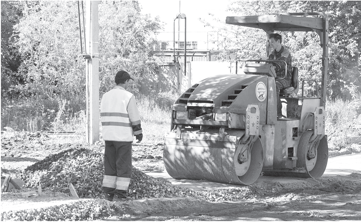
В 2019 г. пересмотрен подход к дорожному строительству

безопасность дорожного движения, развитие сферы услуг, состояние жилищного фонда, обеспеченность коммунальной инфраструктурой и множество других компонентов. Индекс не является рейтингом, а используется органами власти для градации приоритетности шагов по улучшению качества жизни населения. Тобольск в своей группе занял 16 место из 143, уверенно выйдя из аутсайдеров.