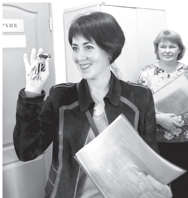
Плановые показатели по переселению из аварийного жилья в 2019 г. перевыполнены

– Уважаемые депутаты, я кратко рассказал, что совместными усилиями нам удалось сделать в 2019 году. Наш город стал первым (среди вторых городов регионов) во всём Уральском Федеральном округе. Это большая ответственность – быть надёжным плечом, партнёром городского лидера по таким ключевым показателям, как качество жизни, комфорт проживания, безопасность и даже уровень человеческого счастья. Нами проделана огромная работа по проекту развития городской среды, который администрация города реализует совместно с правительством Тюменской области и компаниями