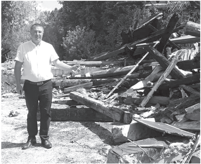
Пока пепелище, но будет сквер, уверен депутат

Депутат ещё в начале разговора поблагодарил всех активистов за помощь ему в решении проблем жителей микрорайона. А сделано вместе действительно немало: дороги оделись в асфальт, появилось восемь новых остановочных комплексов на улицах 3-й Трудовой и 1-й Луговой, почти к 70% частных домов округа подключено водоснабжение, проведена ревизия уличного освещения с целью добавления фонарей, спилены старые тополя, обрезаны деревья, и, наконец, построена современная детская площадка. Кроме того, завершены и необходимые берегоукрепительные работы на дамбе в районе улиц Береговых и Речных, и даже на 2021 год определена подрядная организация на 2020 год по строительству пешеходных зон по улице 3-й Трудовой и 1-й Луговой и велодорожек на улице Ленина.