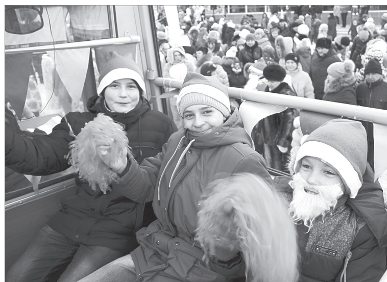
С ветерком в кабриолете прокатились ялutorовские ребятки