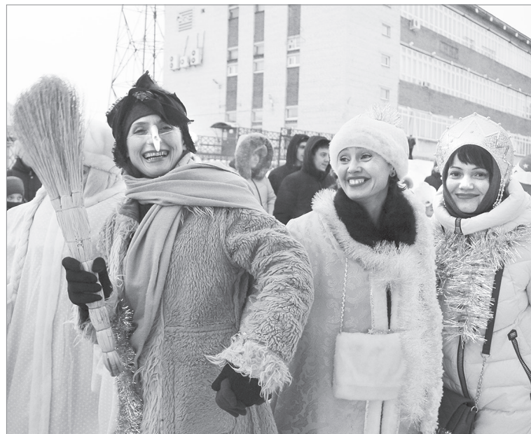
Симпатичная Баба-Яга от ИП Сидоренко