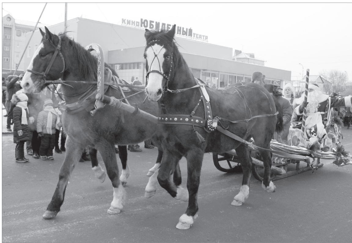
Главный Дед Мороз, как и подобает, прибыл на тройке

Главный приз парада – Снежинку получил сказочный персонаж из школы искусств име-