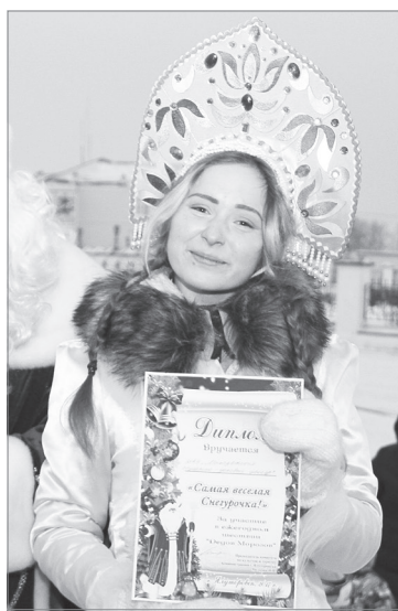
Самая весёлая Снегурочка от молодежного центра Александра Поспелова