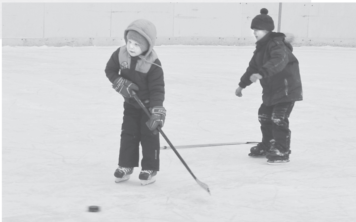
Маленькие хоккеисты осваивают лёд на катке по Свердлова, 51. Площадь арены подходит даже для соревнований

Жителям микрорайона близ спортшколы дорога за активным отдыхом пролегает к ледовой арене на ул. Кармелюка. Кстати, это самый большой в городе открытый каток, причём единственный, где есть прокат коньков, час которого стоит менее 100 рублей. Им можно вос-