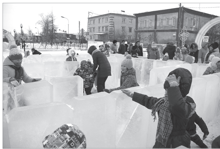
Где, где же выход?! Лабиринт в этом году захватывающе сложный