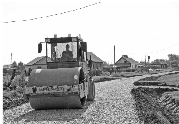
› С. Чебаклей, ул. Советская