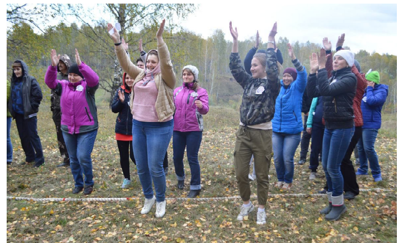
Команда налоговой инспекции разминается перед соревнованиями

Татьяна МАКАРОВА