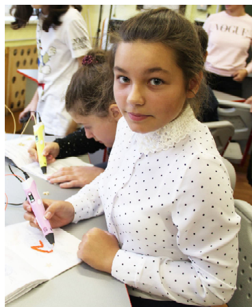
3D-ручкой можно нарисовать любую картинку

- В марте в школу поступил приказ Департамента образования Тюменской области, где говорилось, что в сентябре в регионе должны заработать 28 Центров «Точек Роста». В Омутинском районе для этой цели была определена базовая средняя школа номер один. Для нас это было неожиданно и интересно. Мы начали с создания команды единомышленников, куда вошли коллеги, кто имеет желание развиваться, заниматься творчеством, не считаясь с личным временем, работать в вечернее время, выходные дни. Затем мы стали создавать программу, разрабатывать направления, думать, что можем предложить ребятам