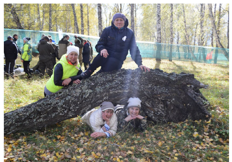
Импровизированная лесная фотозона