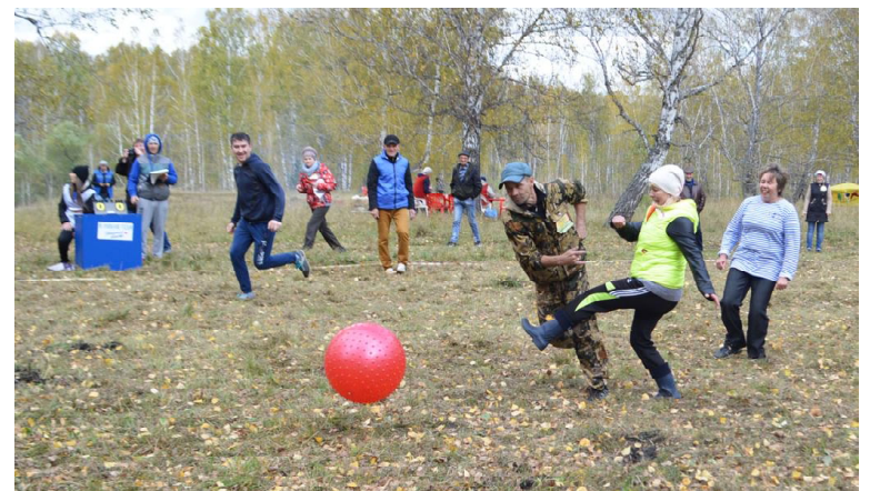
Женская команда коррекционной школы не уступает мужчинам в мини-футболе