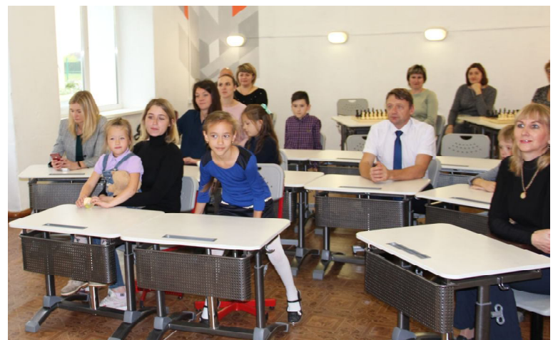
В одном из кабинетов «Точки роста»: родителям и детям рассказывают о цифровых технологиях