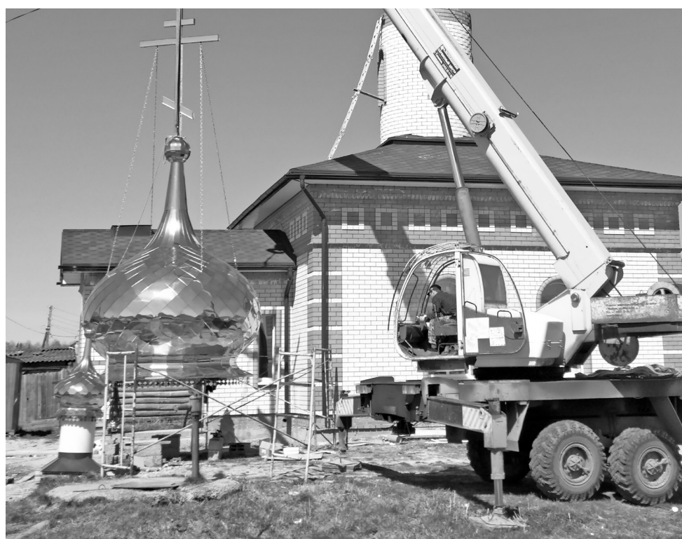
Рабочая бригада заканчивает наземные монтажные работы и готовится к поднятию главного купола.