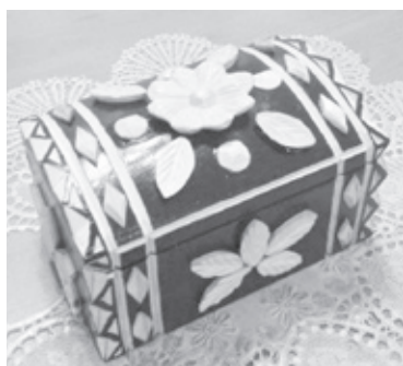
|| Фото автора

Успевает Александр ухаживать за хозяйством, семья держит крупно-рогатый скот, который требует внимания, птицу. Чтобы облегчить труд на большом огороде сам к трактору смастерил окучник, плуг, картофелекопалку. Он хорошо разбирается в технике, электрике, сварочном деле.