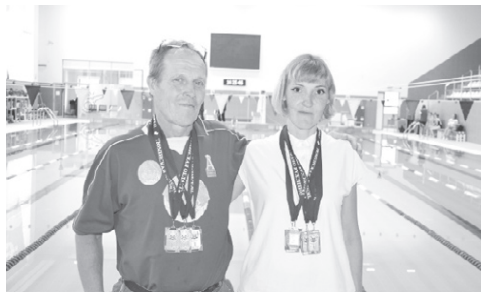
|| Фото из архива ДЮСШ

Поздравляем наших спортсменов с победой и желаем новых достижений.