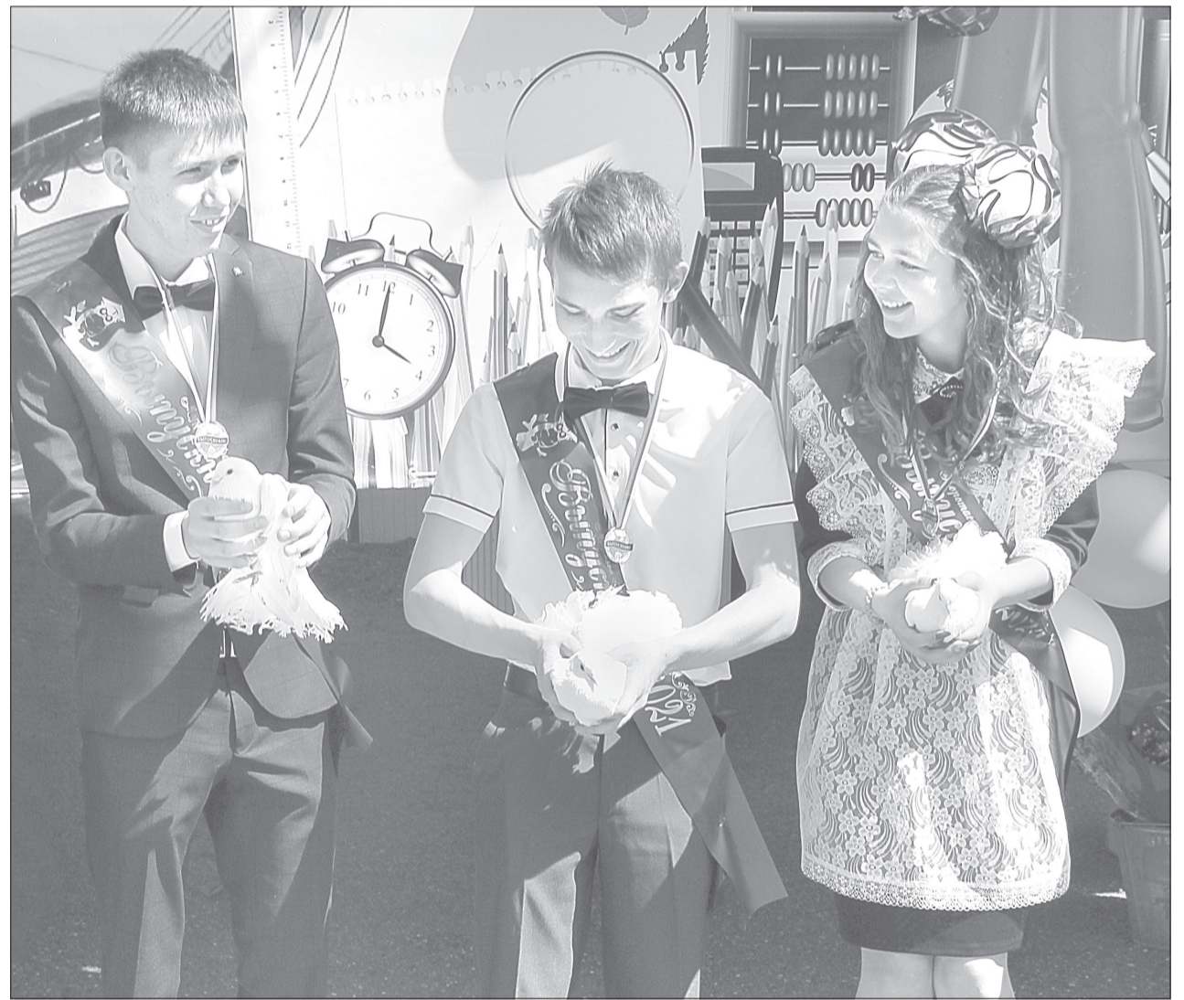
Карабашские школьники возобновили традицию - выпускать в небо голубей

Последний звонок прозвучал для 337 одиннадцатиклассников города и района