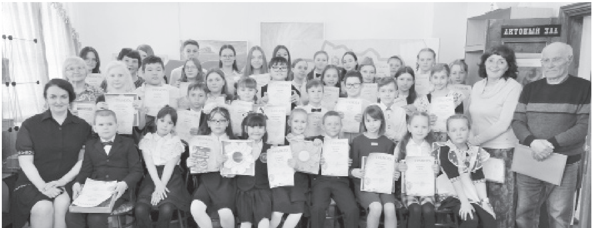
|| Фото автора