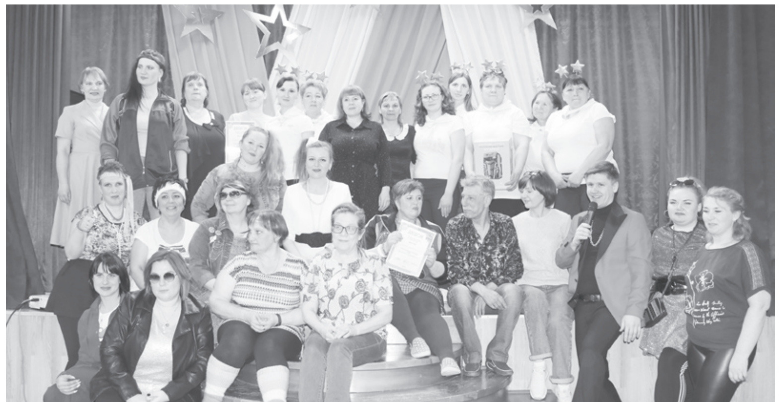
|| Фото автора

Вспомнили компьютерные и дворовые игры, телепередачи, песни, артистов и певцов, попытались соотнести рекламные ролики и выражения из них и даже сделать ставки на свои ответы. Секунды на размышления сопровождалась