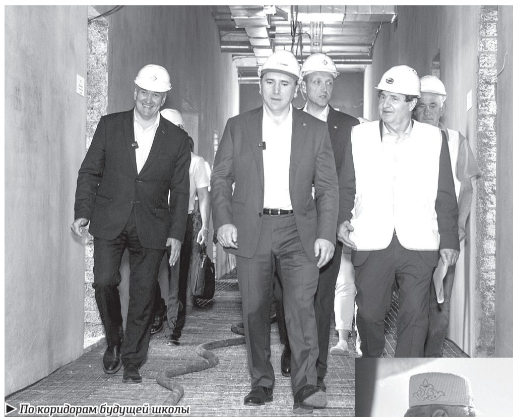
По коридорам будущей школы

Губернатор Тюменской области Александр Моор в минувшие выходные посетил Тобольский район