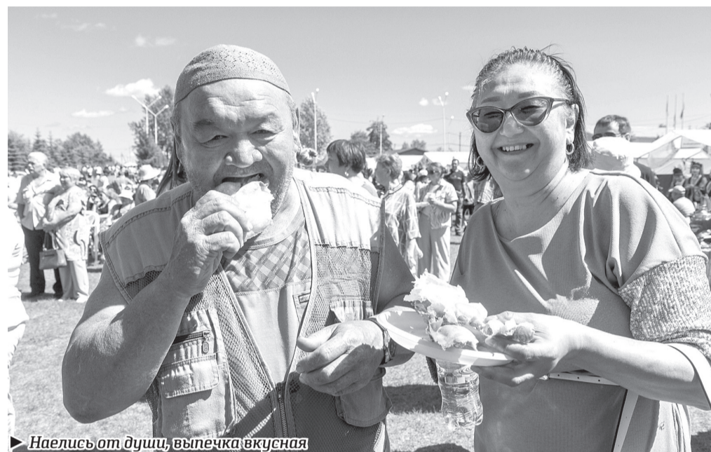
Наелись от души, выпечка вкусная

К празднику «Сибирский баурсак» в спортивно-оздоровительном комплексе «Сибиряк» высокие гости успели вовремя. Губернатор первым приветствовал