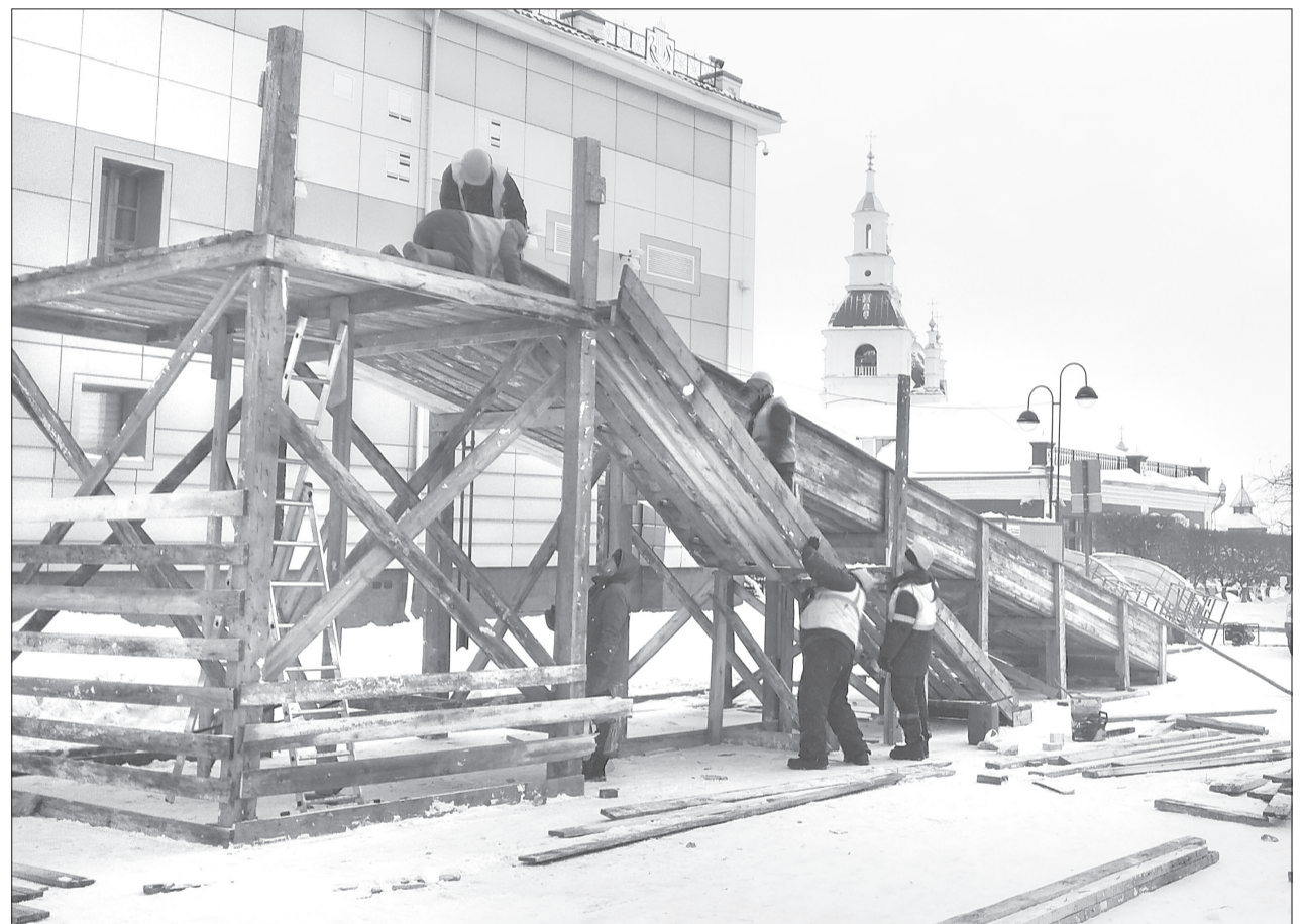
Строительством горок в ледовом городке занимаются рабочие ООО «ТСК-Регион»