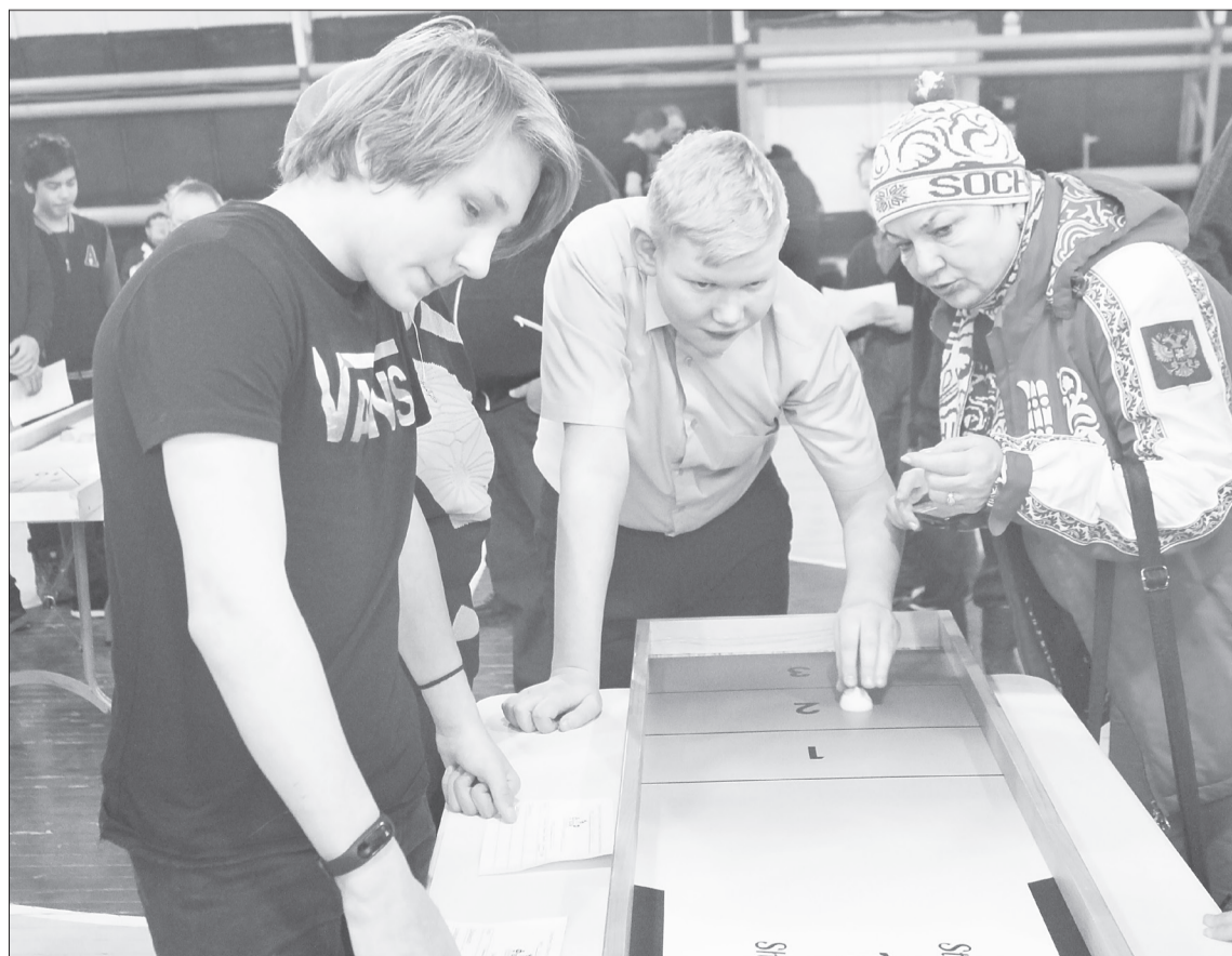
Правила старинной английской игры «Шаффлборд» ученики «шестой» школы поняли сразу

■ Проект «Настольные игры для всех» реализуется на средства областного департамента физической культуры, спорта и дополнительного образования