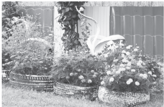
Упоровские пенсионеры украшают свои приусадебные участки.