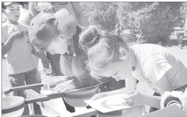
Зонты, бабочки, стрекозы... Мотивы из цветного песка