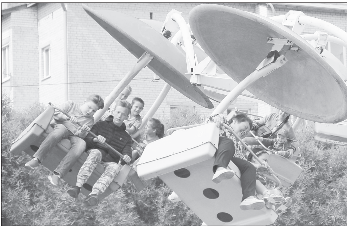
Из желающих покататься на каруселях выстраивались длинные очереди

■ СПРАВКА «ЯЖ». Конкурс «Семья года» проходит уже в четвертый раз. В этом году в Ялуторовске его победителями стали Рявкины (первое место в номинации «Многодетная семья»), Куркины (первое место в номинации «Молодая семья»), Ильясовы (первое место в номинации «Семья – хранительница традиций»).