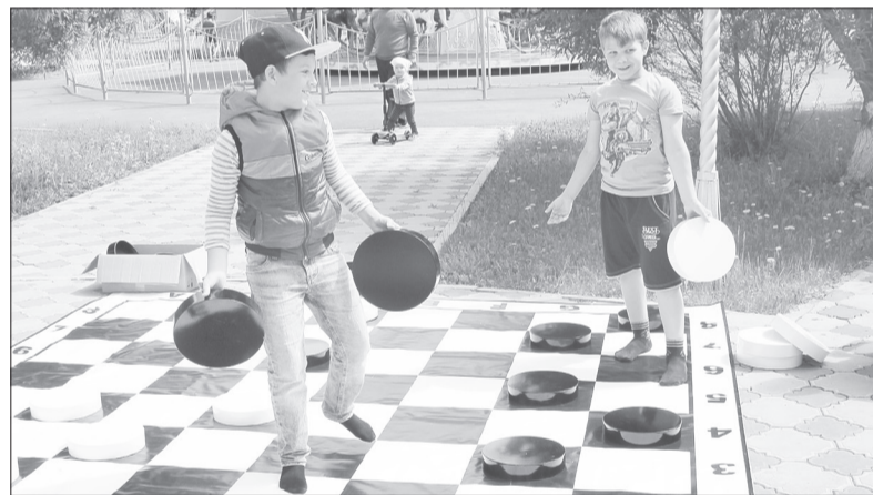
На огромной шахматной доске сражаться особенно увлекательно