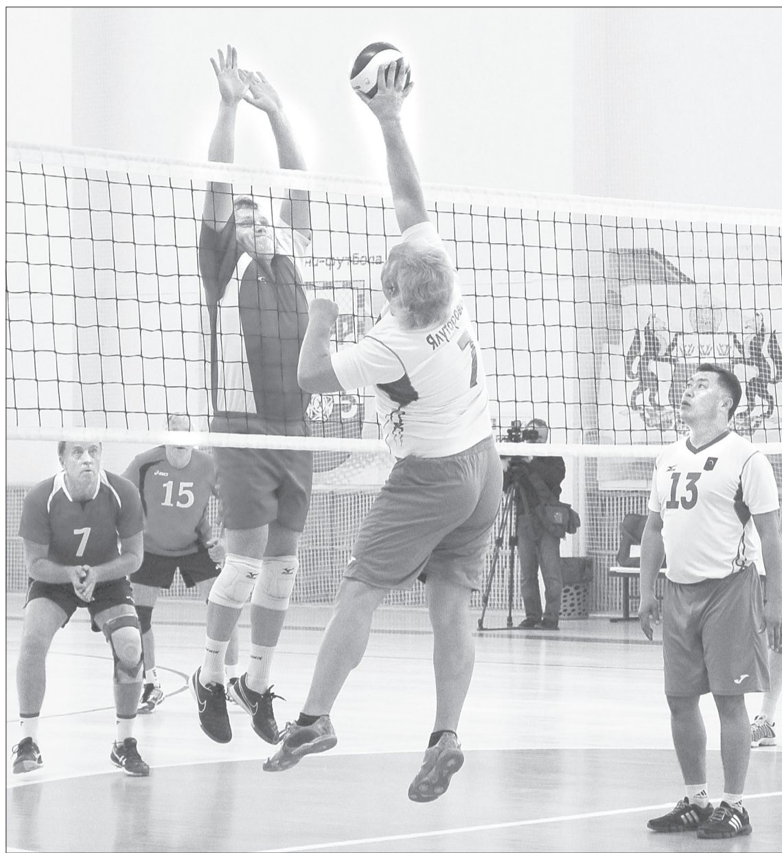
В волейболе ялutorовским депутатам опыта всё же не хватило

Спикер напомнил, что главная задача столь внушительного десанта – изучить особенности и инновационные наработки территорий, чтобы