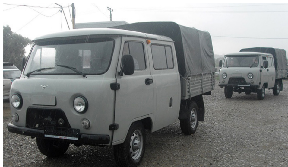
УАЗы поступили в районы

Весна и начало лета выдались для Тюменского региона напряжёнными.