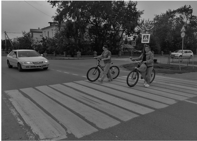
Сорокинские подростки соблюдают ПДД