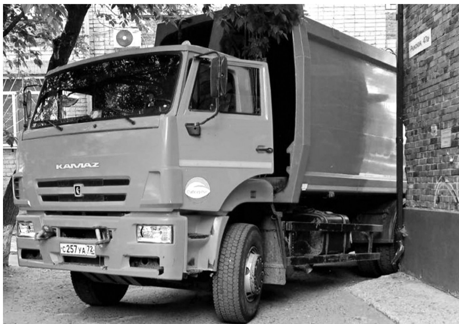
На вывозе мусора занята спецтехника

Оперативно реагировать на вопросы жителей региона – важная составляющая в работе регионального оператора.