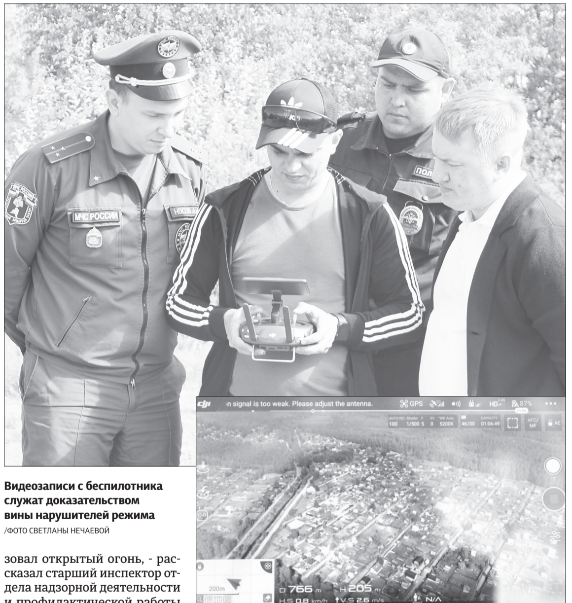
Видеозаписи с беспилотника служат доказательством вины нарушителей режима

Квадрокоптер позволяет реагировать оперативнее, а видеозапись докажет, что человек действительно исполь-