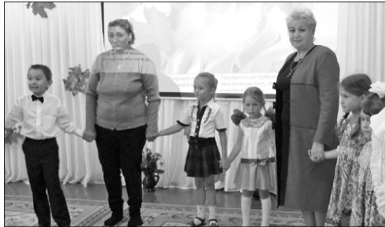
«Урок добра» в детском саду «Вишенка»

Ирина ГРАБКО.