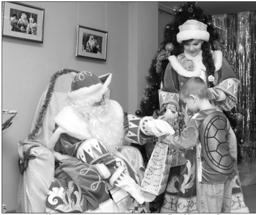
Новогоднюю сказку дарят детям Дед Мороз и Снегурочка

Надежда ЧЕРЕПАНОВА.