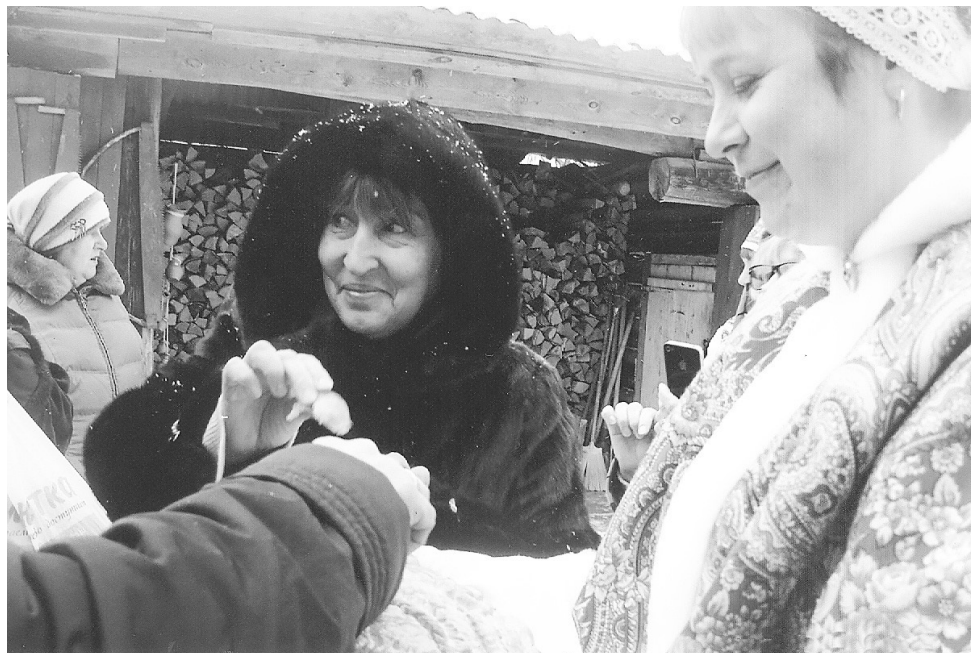
Члены нижнетавдинского землячества «Югра» в гостях в «Сибирском подворье».