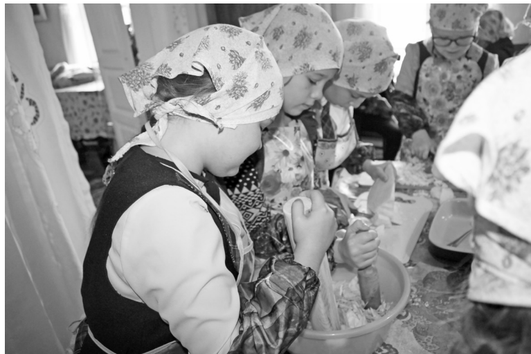
Усердно трудятся будущие хозяйшкы, да и мальчкы от них не отстают. У кого капустка вкуснее?