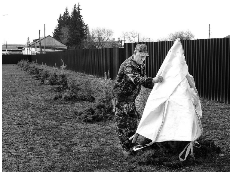
В парке «Семейный» снимают укрывной материал с зеленых насаждений