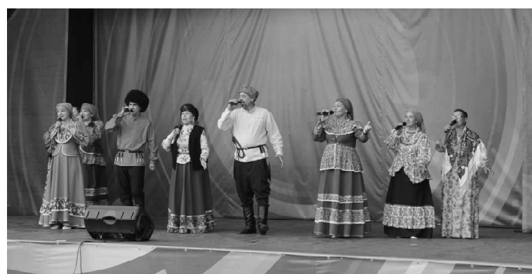
Ансамбль русской и казачьей песни «Начало» выступает на открытии фестиваля

После объявления регламента «Ермаковых игр - 2023» участники разошлись по фестивальным локациям. Взрослые и дети смогли посетить мастер-класс по изготовлению магнитов, подков, браслетов из фоамирана, фетра и джутовой нити, подготовленный мастерицами Большекрасноярского сельского поселения. Около районного Дома культуры работал тир, где можно было пострелять из пневматической винтовки. Рядом на интерактивной площадке проходили водяной волейбол, игры «Мешочки», «Чашка с ложкой», «Топорики» и другие забавы. На