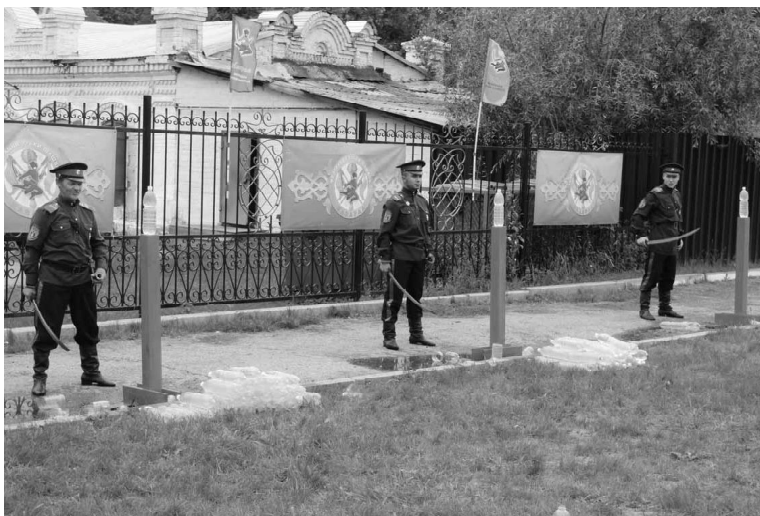
Команда Омутинского ХКО готовится к рубке шашкой

С этим отлично справились наши девчонки, в категории 10 - 13 лет они не уступили ни одного призового места. Побе-