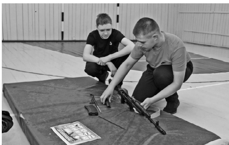
➤ Сборка-разборка автомата