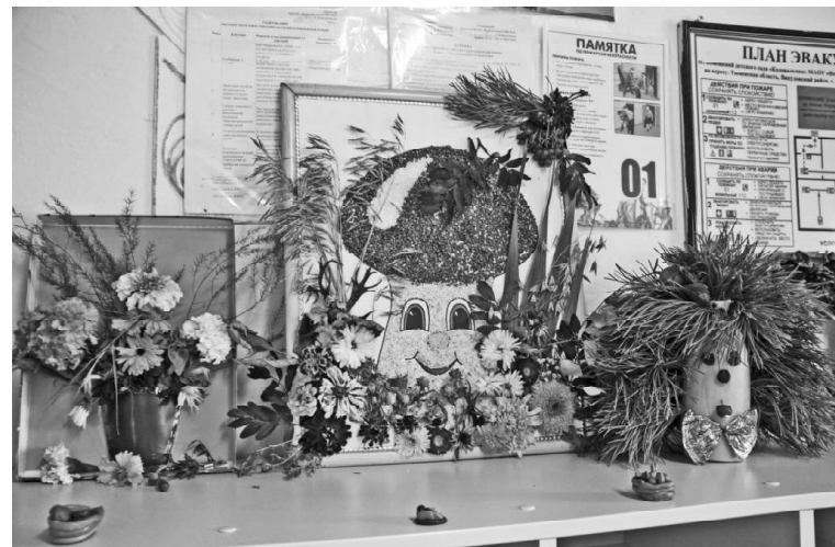
➤ «Осенние мотивы»