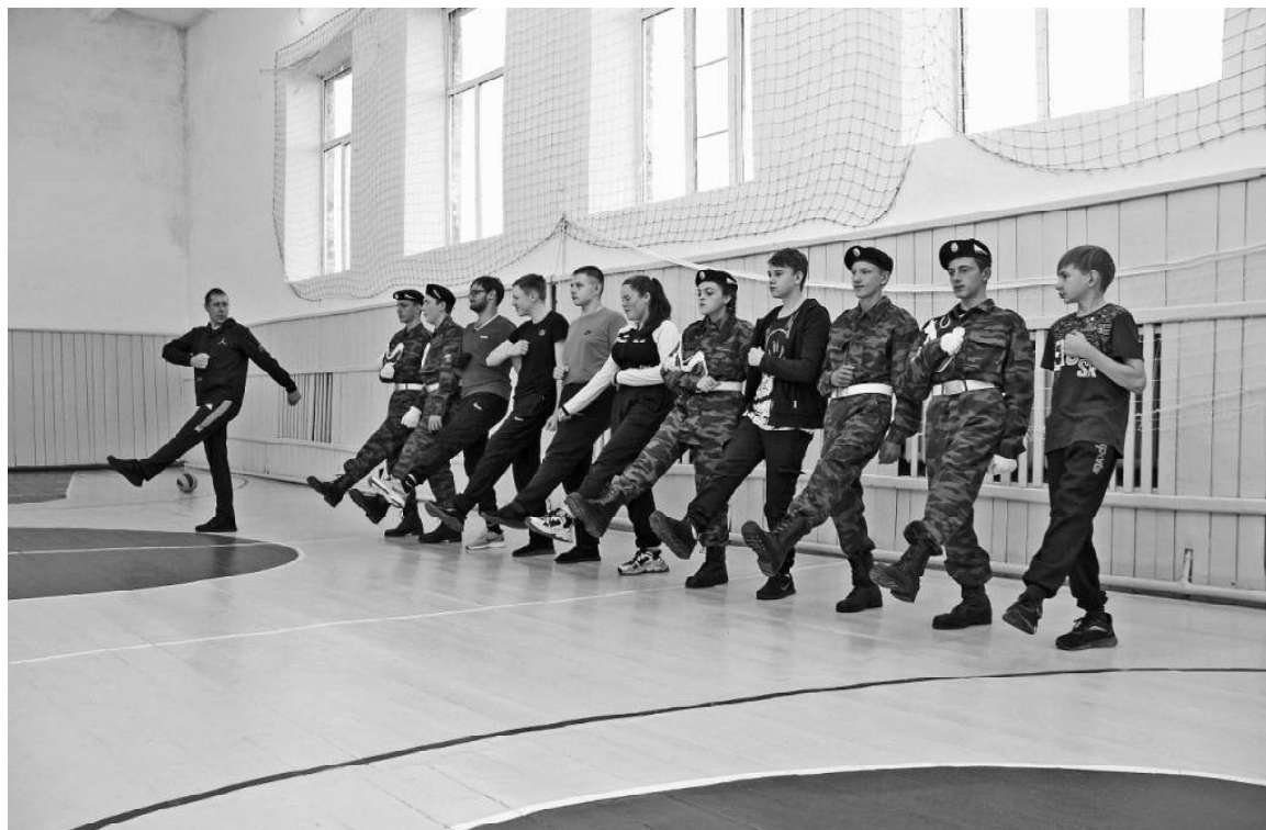
➤ Строевая подготовка