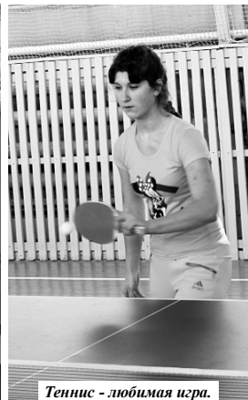
Теннис - любимая игра.