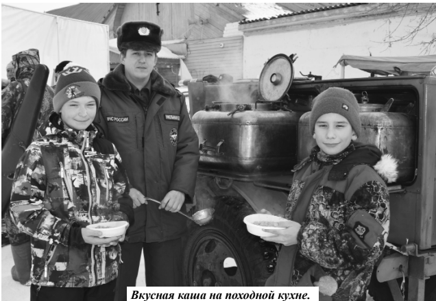
Вкусная каша на походной кухне.