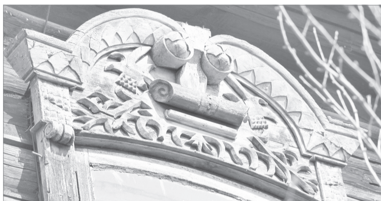
От былого великолепия домовой резьбы остался только наличник