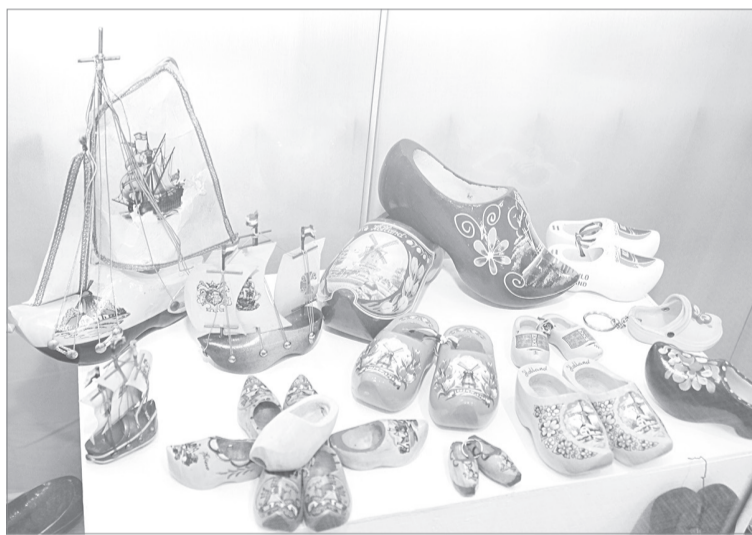
Миниатюрные башмачки выполнены чрезвычайно искусно с применением различных рукодельных техник

- Дело в том, что эту танцевальную обувь изготавливают вручную из пятидесяти деталей, и только из натуральных материалов. Кожу используют исключительно со спины коров. Ба-