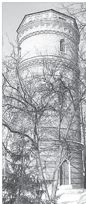
Станционная водокачка - памятник технической мысли

ритории появилось новое учебное заведение - школа №5.