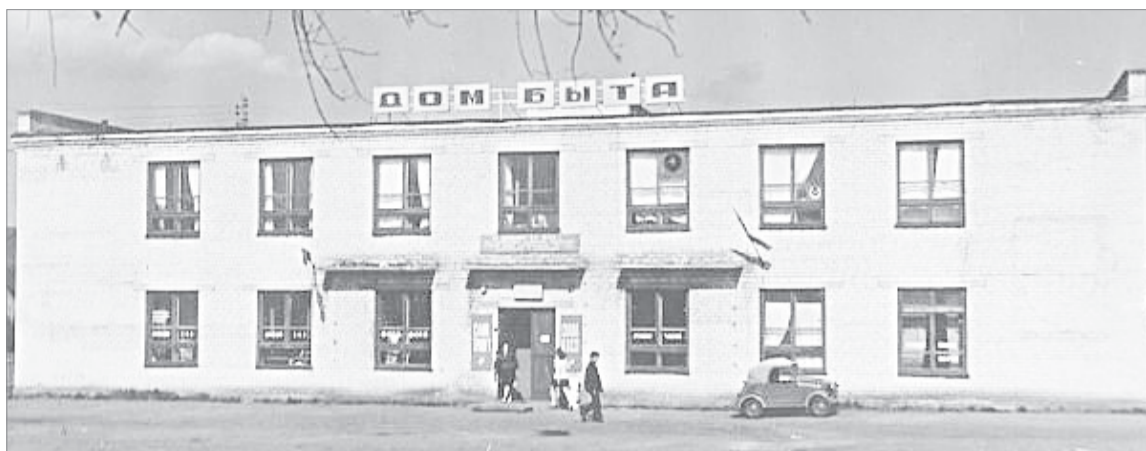
Сегодня таким здание «Дома быта» помнят лишь старожилы, раньше здесь оказывали всевозможные услуги населению

Квартал нечетной стороны от Оболенского до Свободы также можно назвать просвещенческим. На одном углу с незапамятных времен располагалось старое покосившееся двухэтажное здание школы для слепых и слабовидящих детей, открытой в победном сорок пятом году. Когда в 1970-м для неё построили на улице Пионерской новый корпус, старый снесли. Позже, в 2001 году на прилегающей тер-