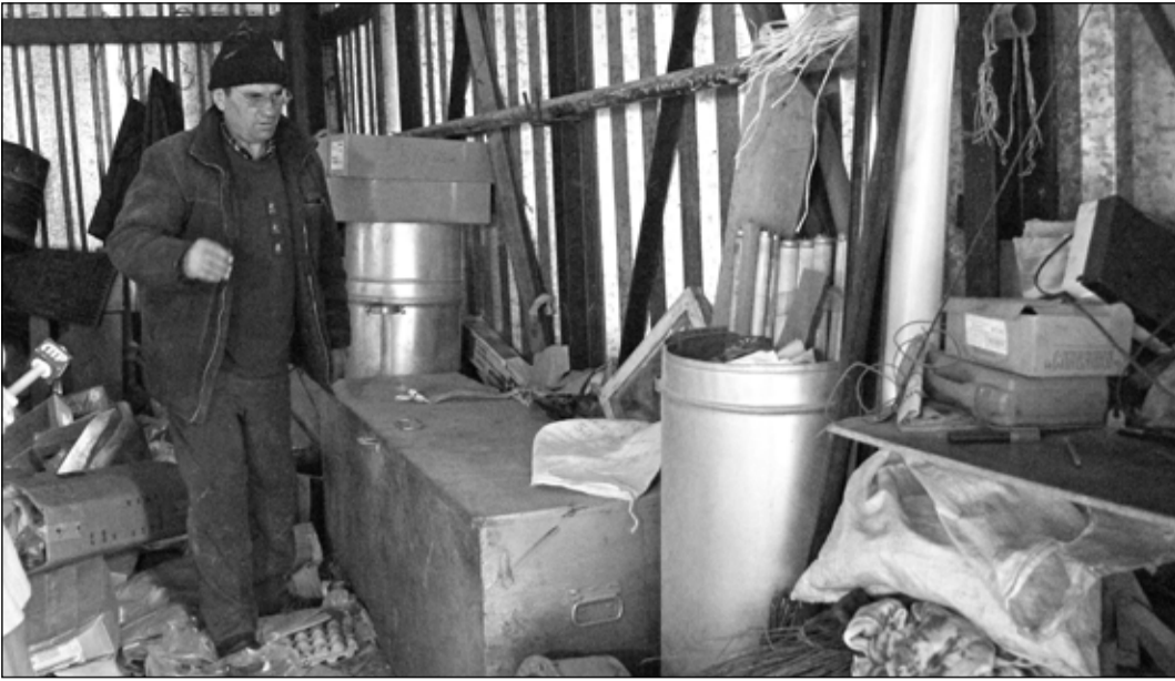
Вот так хранятся принятые на утилизацию лампы на полигоне Теплоцентра