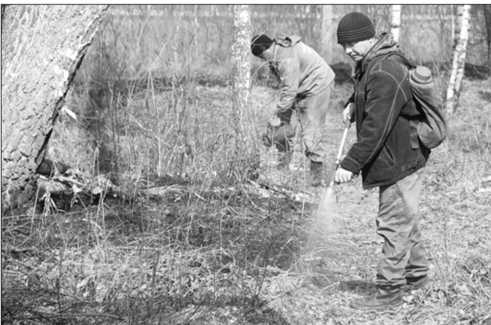
На 17 апреля лесники произвели отжиги на 70 процентах плановых площадей