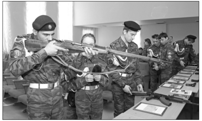
Экспозиция оружия особенно привлекала мальчишек

Обучаются курсанты на бесплатной основе, получают не только военные знания, но и осваивают гражданские профессии, специалистов связи и ра-