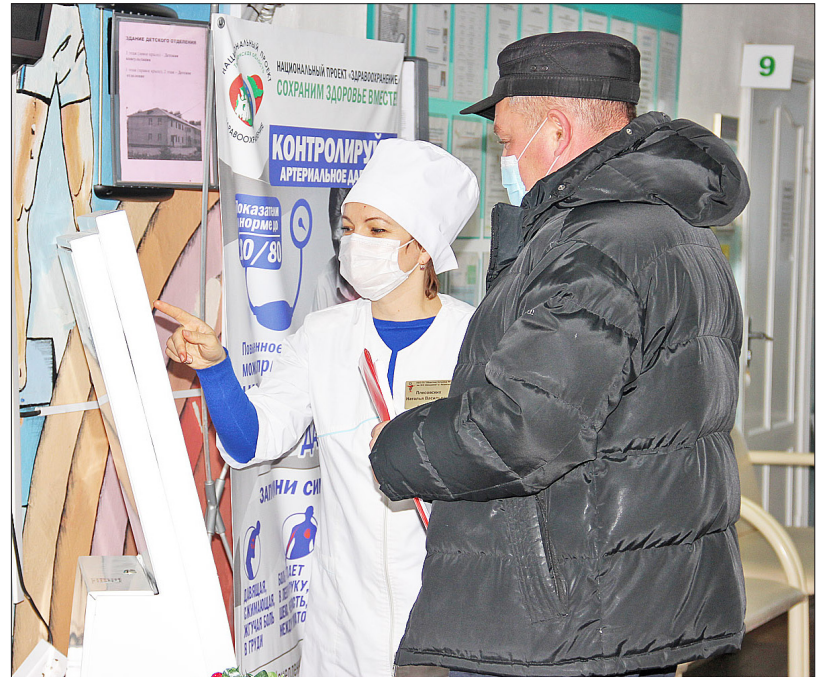
Регистраторы помогают посетителям записаться на приём к нужному специалисту

навирусу, и можно ли в нашей поликлинике сдать кровь на антитела?