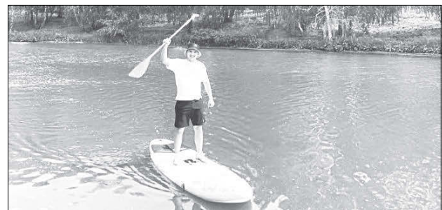
На фестивале можно будет опробовать сапбординг - самый развивающийся вид сёрфинга