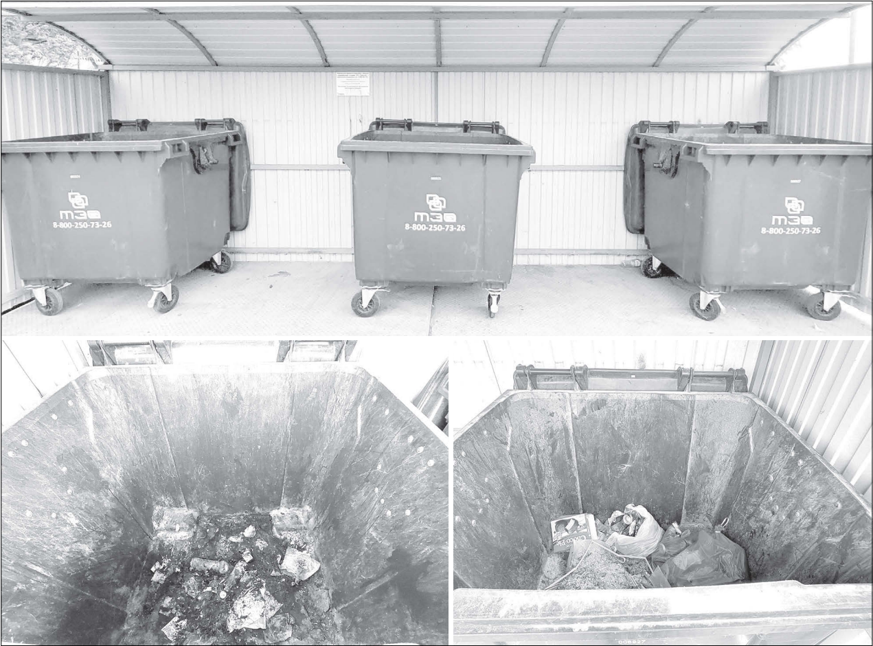
Содержать мусорные контейнеры в надлежащем санитарном состоянии - обязанность ТЭО. Особенно актуально это в тёплое время года

Когда и как должны обрабатывать мусорные контейнеры?