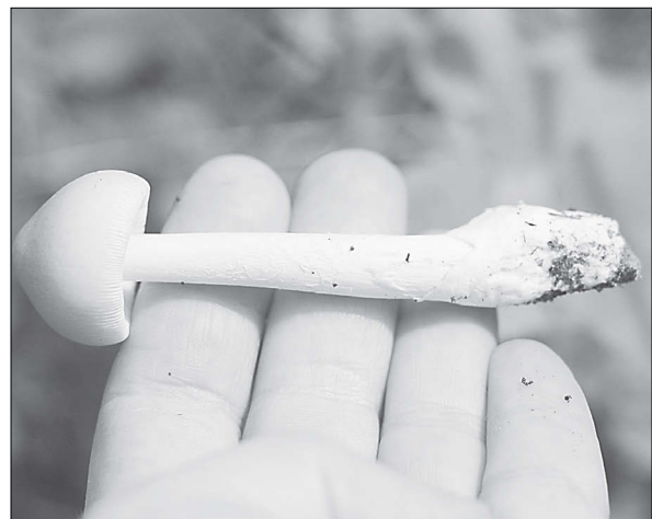
Поплавок шафранный - съедобный гриб из семейства мухоморовых

Как правильно собирать грибы и можно ли варить суп из говорушек?