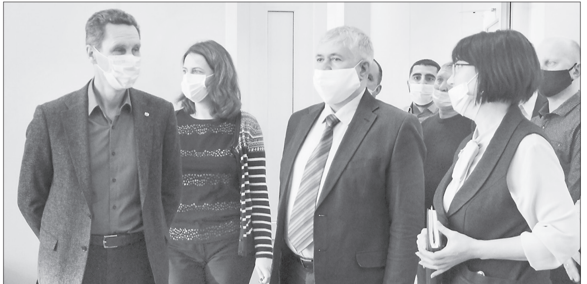
Новую детскую школу искусств построили за счёт средств областного бюджета

Кстати, помещения учреждения и коридор спроектированы с учётом потребностей