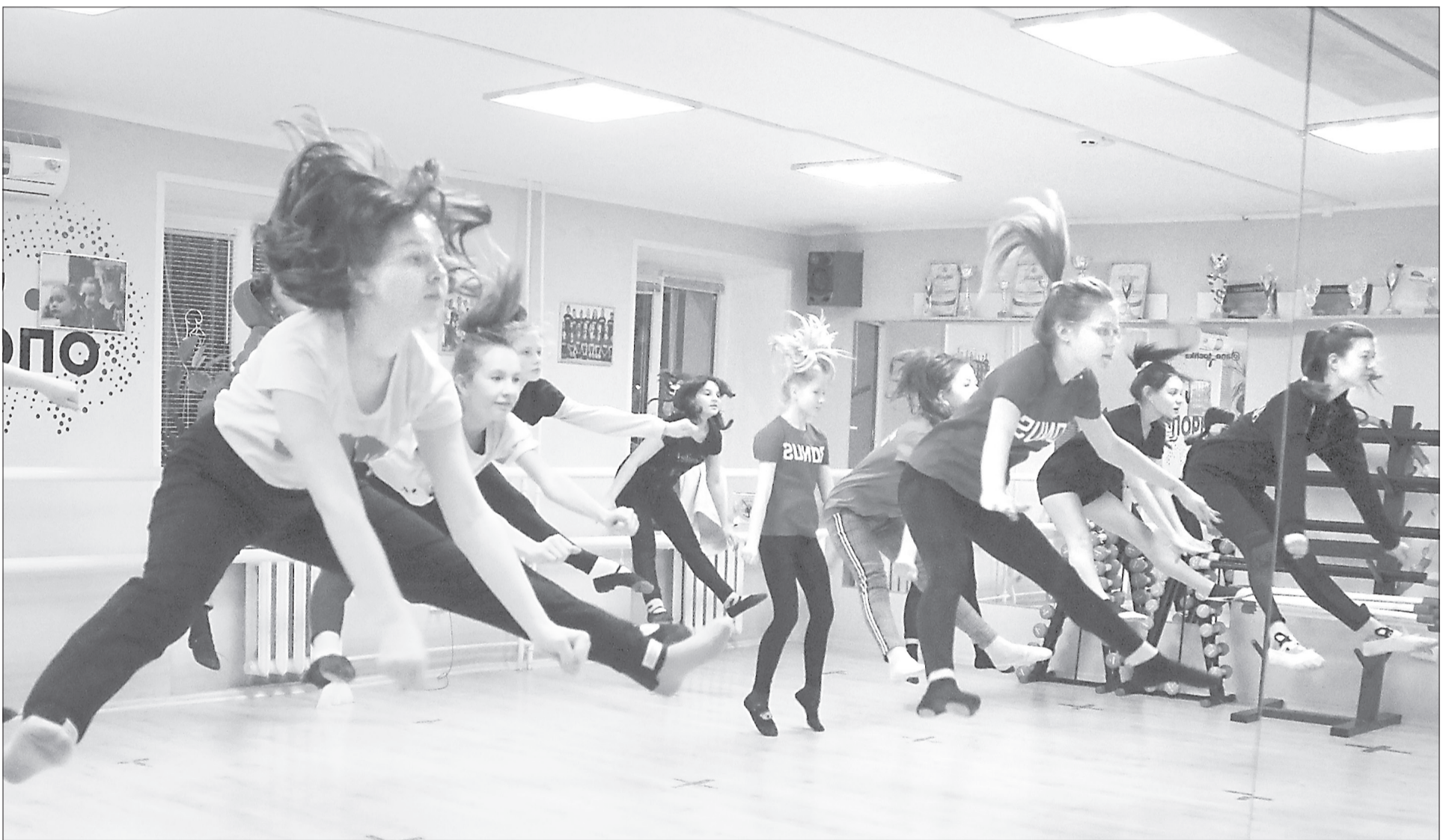
Команда «Бонус» отрабатывает чир-прыжок перед зеркалом

Семьдесят ялуторовчан через неделю отправятся на чемпионат по чирлидингу