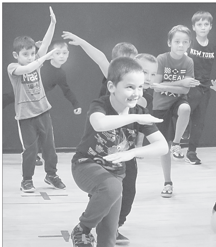
Хип-хоп культура очень привлекает мальчиков. Кроме обязательных элементов тут тоже много импровизации

■ КСТАТИ. Средняя численность команды по чирлидингу – 20-25 человек.