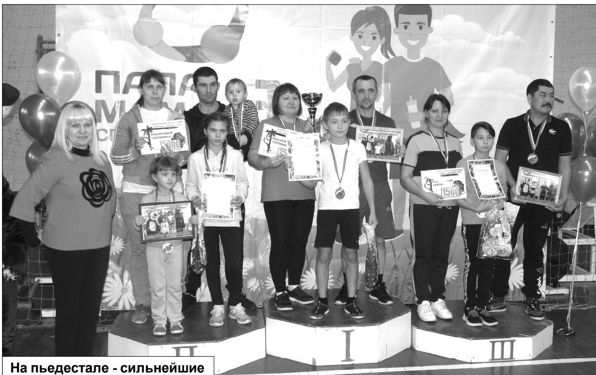
На пьедестале - сильнейшие

А места распределились следующим образом: в номинации «Радиотехника и электроника» победили ребята из Красноорловской школы; в «Роботехнике» первое место завоевали южнодубровинцы; в номинации «Макеты и модели исторических событий» лучшими стали армизонцы. Ну, а в «Конструировании и моделировании» и «Техническом творчестве» не было равных ребятам из Дома творчества.