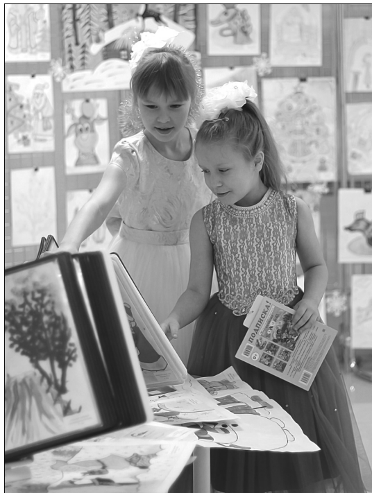
Более 120 рисунков – иллюстраций к зимним сказкам получила библиотека от участников конкурса

Надежда ЧЕРЕПАНОВА