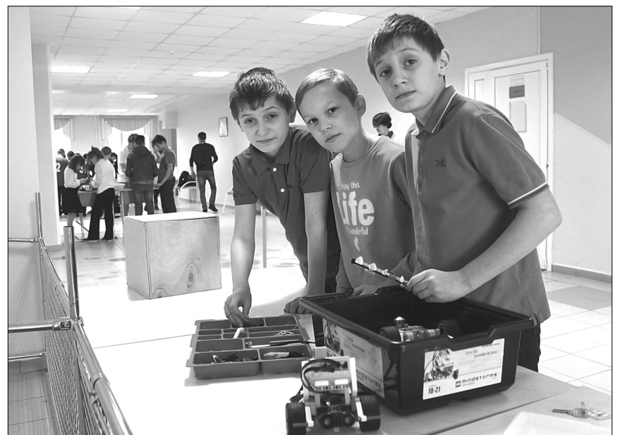
Мальчишки увлечённо конструировали робота, стремясь к победе