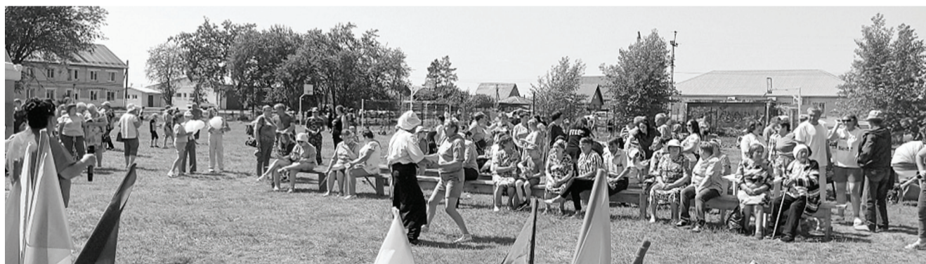
Как всегда, новолоктинцы отметили День села с размахом, весело и интересно. // Фото предоставлено администрацией Новолоктинского сельского поселения.

Весело и шумно отметили в Новолоктях День села.