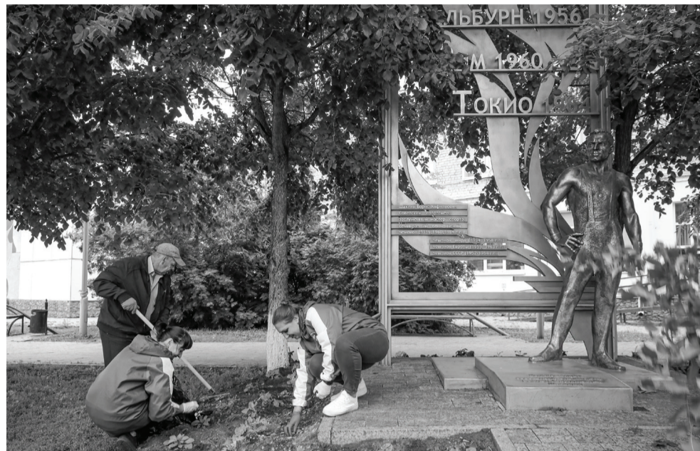
Ветераны спорта и подрастающее поколение навели порядок у памятника олимпийскому чемпиону Борису Шахлину: убрали закрывающие скульптуру ветки, посадили цветы.

– Борис Шахлин – это наша гордость, имя, известное каждому ишимцу. Это правильно, что память об олимпийском чемпионе живет в его родном городе