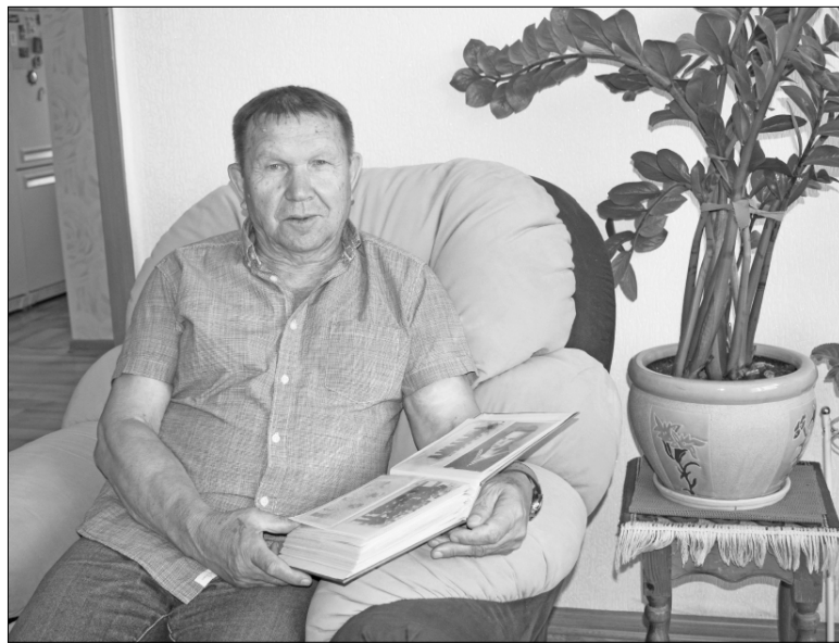
У юбиляра хранятся фотоальбомы со снимками армейской службы во Владивостоке и семейные фотографии.

– Начинать матросом на пассажирском судне, затем работал на