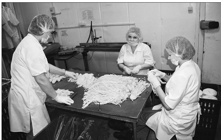
Рабочие сырного цеха делают вкусный сыр «косичку», который пользуется большим спросом у населения.