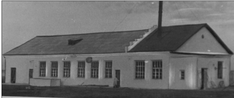
Так раньше выглядел механизированный маслозавод в Бердюжье. Такие же здания были в Уктузе и Пеганово.

Предприятие было организовано восемнадцать лет назад на базе некогда существовавшего Бердюжского молочного завода. Начинали с небольших объемов и ограниченного ассортимента «молочки», расширяя и модернизируя производство с каждым годом. Сегодня здесь трудится 170 человек. Предприятие продолжает расти и развиваться.