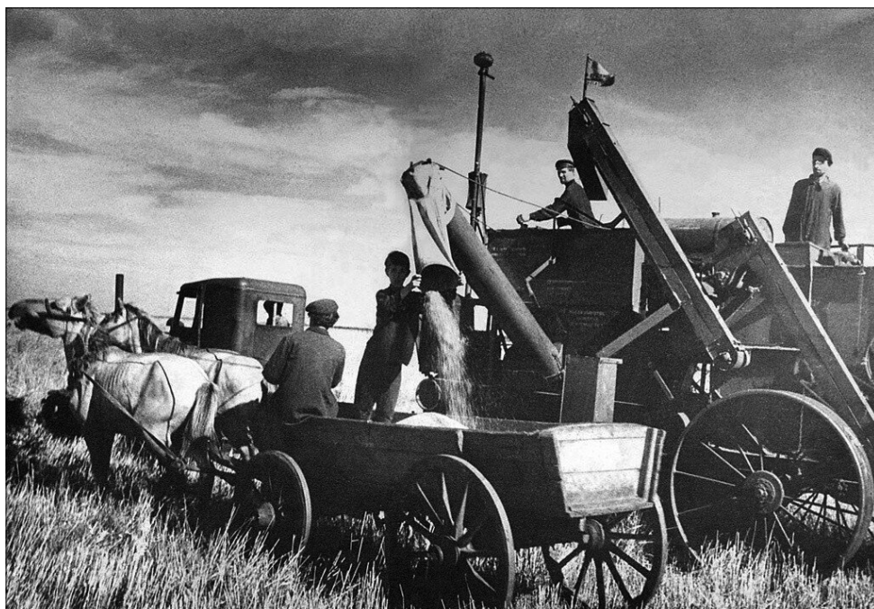
На таких прицепных комбайнах «Коммунар» крестьяне собирали урожай.

В крайне тяжелых условиях четырех военных лет в районе работали 3829 тру-