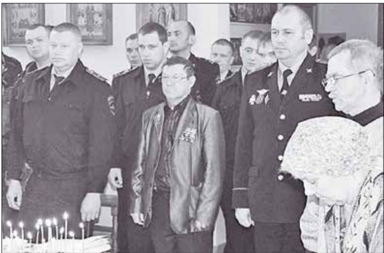
Голышмановские полицейские на панихиде в честь коллег, погибших при исполнении служебного долга