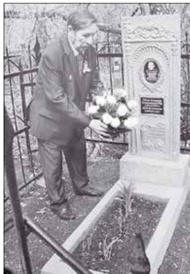
Цветы на могилу отца – дань памяти