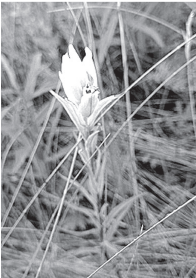
Кастиллея бледная. Цветение.

Это маленькое растение внесено сразу в две «самые-самые» книги Тюменской области: Книгу рекордов и Красную книгу.