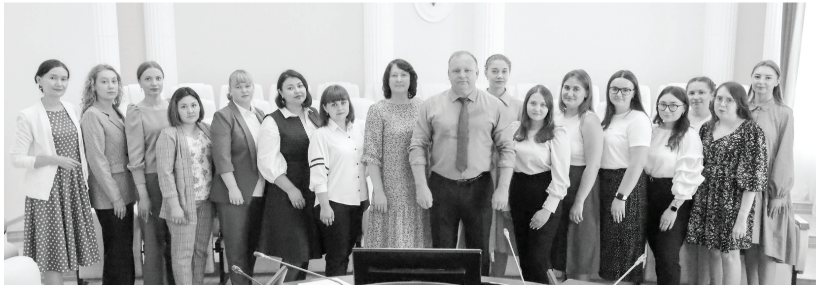
Заседание в администрации – установочная встреча, на которой молодым специалистам рассказали о перспективах работы в сфере образования, о том, какую помощь и поддержку им может оказать город.

– В проекте на данный момент состоит 136 педагогов из всех школ города. Сегодня к нам пришли еще 30 человек. Но это не финальная цифра, изменения могут быть до сентября, – отмечает Вера Сергеевна. – У нас много форм работы: здесь и методическая поддержка, и психологическая, работа с наставниками – педагогами с большим стажем. Но мы не только учим, мы в неформальной обстановке