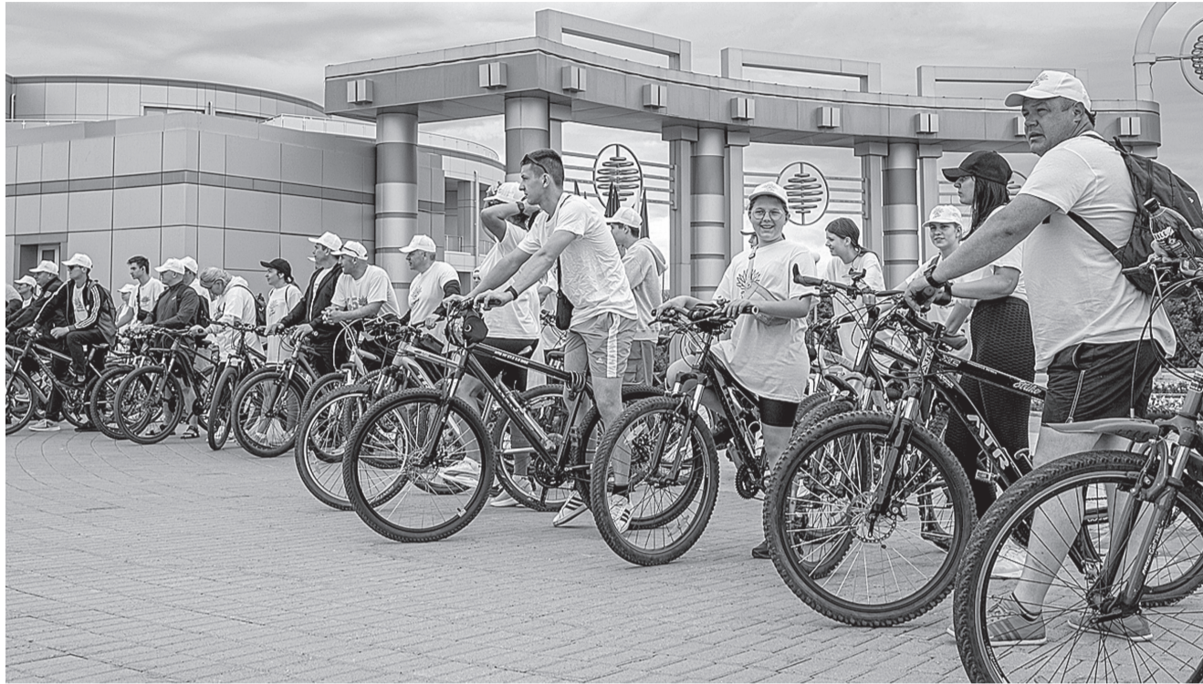
15 июля более ста сотрудников компании и члены их семей отправились на велопробег – традиционное летнее мероприятие, один из ярких моментов спортивной жизни холдинга.

После часовой велопрогулки организм настойчиво просит сытной еды, поэто-