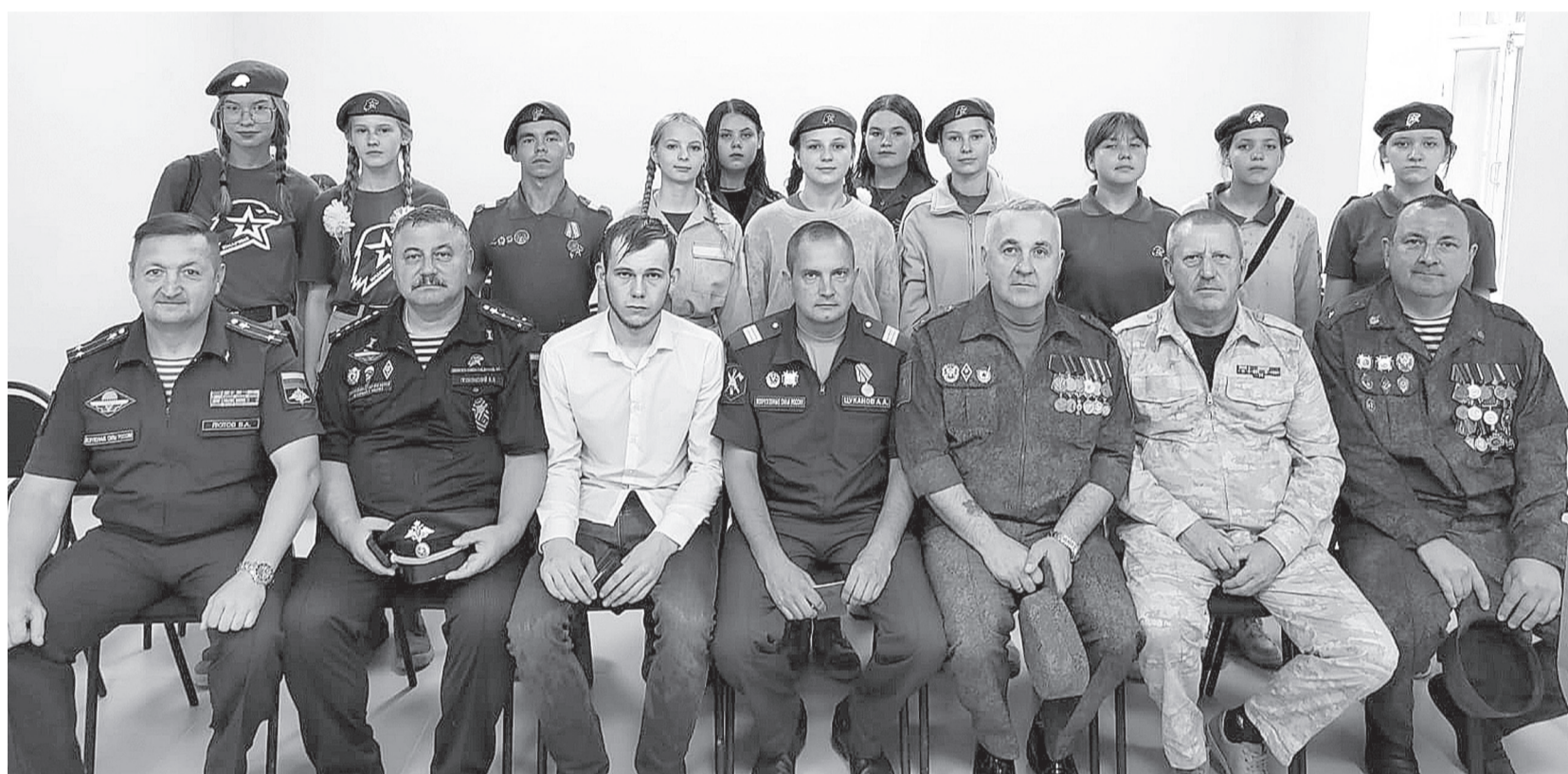
На мероприятии присутствовали юнармейцы города. Для патриотически настроенной молодежи Ишима такие встречи несут большую ценность.