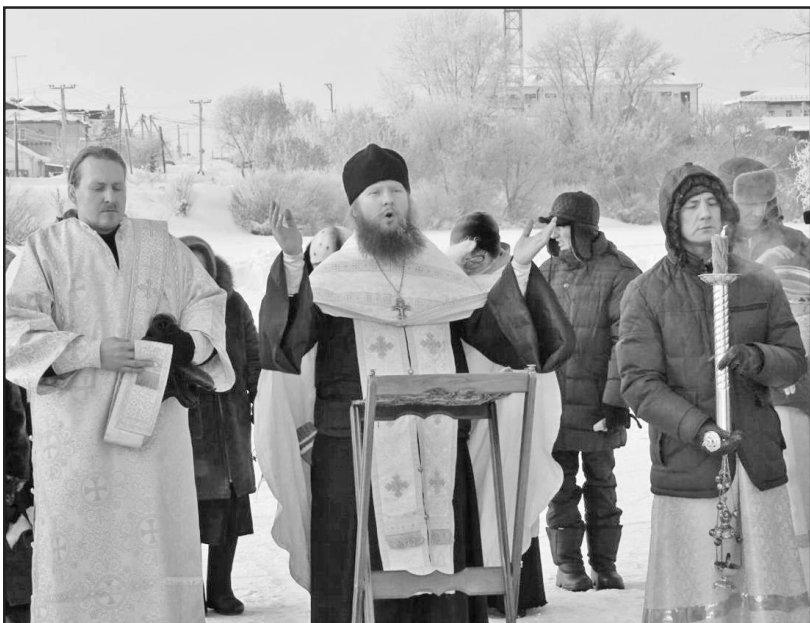
Прощение о том, чтобы Господь освятил воду