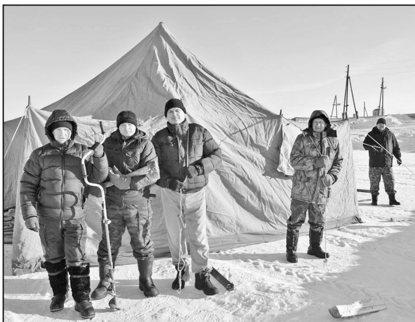
Добровольные и бескорыстные создатели крещенского городка