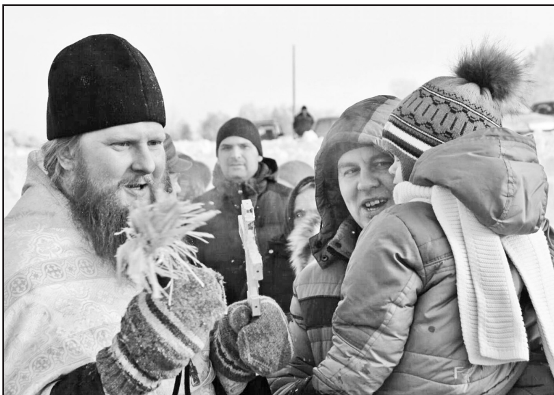
Благодать осеняет воздух, воду и людей