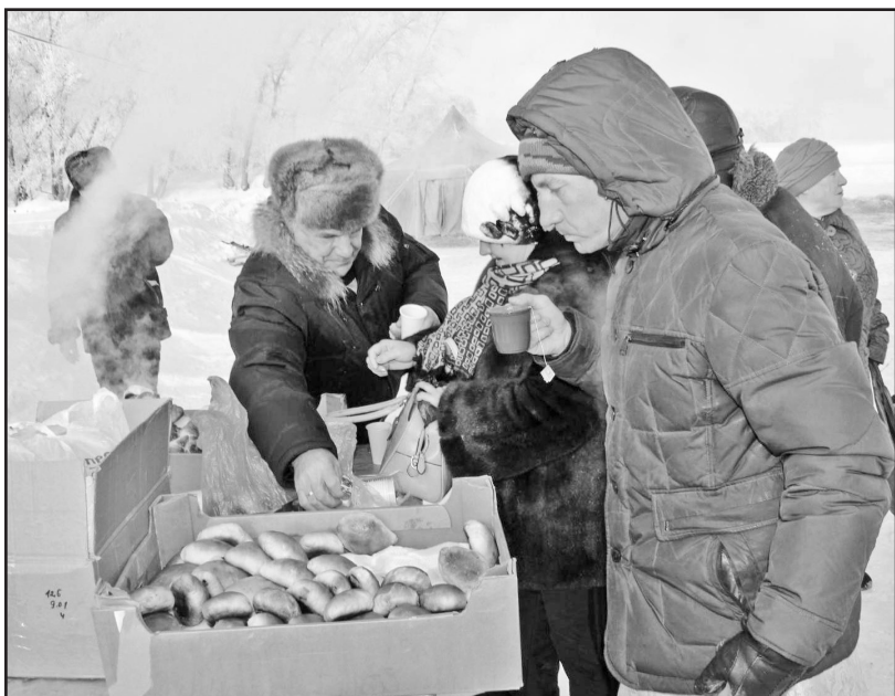
Святое дело бывает и вкусным