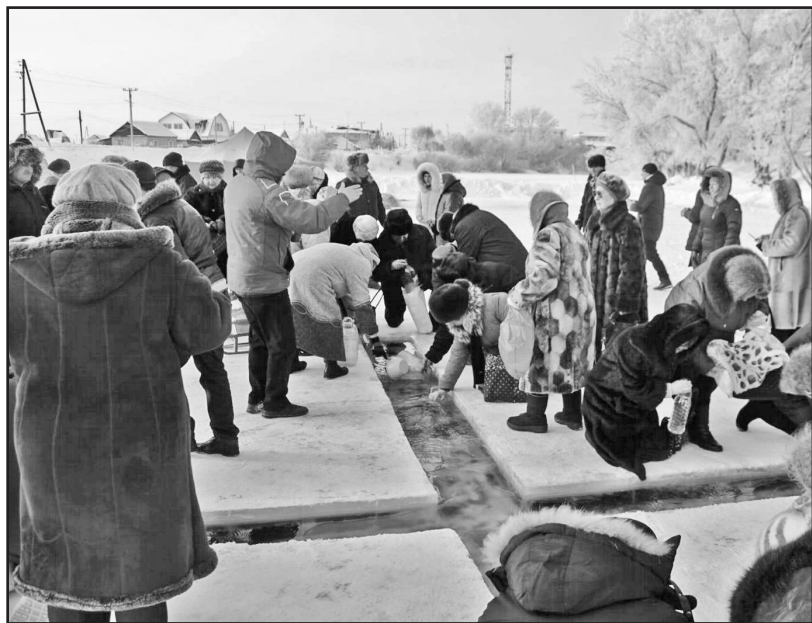
Всем хочется святости, да побольше