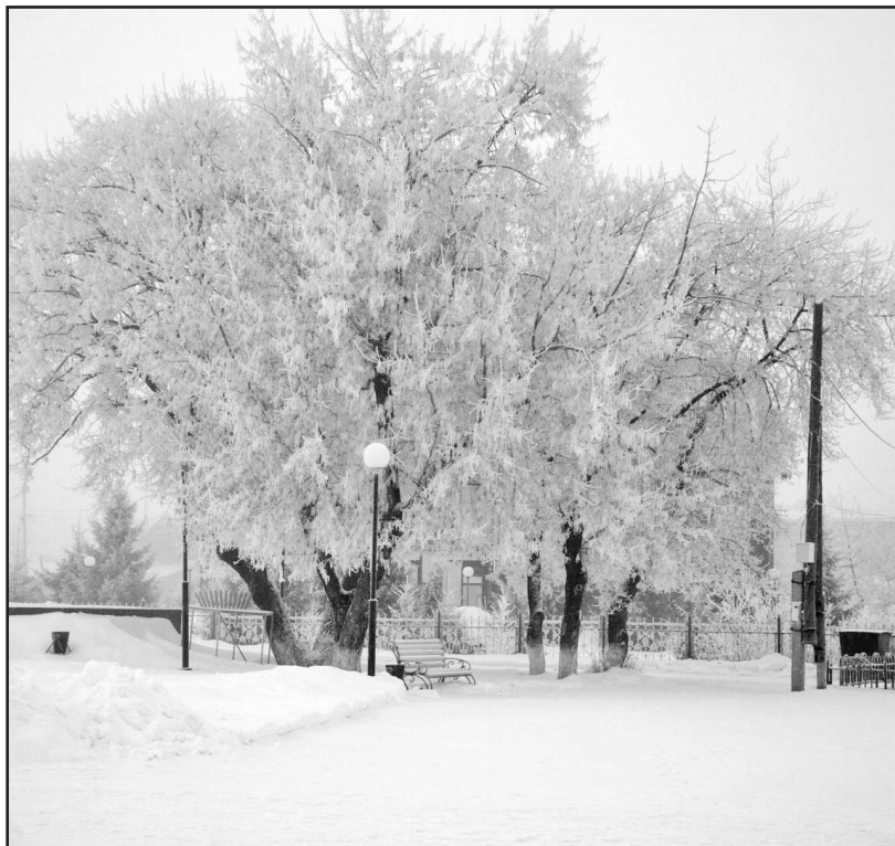
Радует глаз зимний пейзаж

А ещё зимой нельзя забывать о братьях наших меньших. Повесить кормушку для воробьёв, привязать