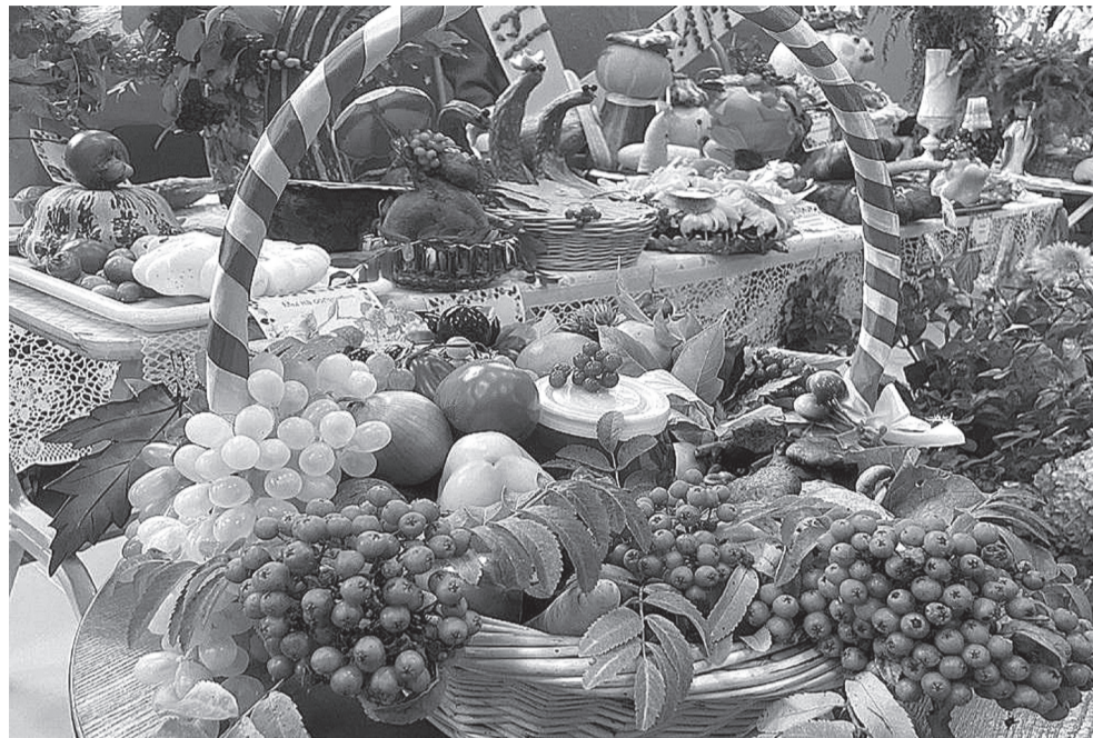
Мероприятие сопровождалось творческими номерами, подготовленными участниками осенней ярмарки. Доход от продажи излишков урожая ветераны передали в пользу участников СВО.

И пусть в этом году природа не дала в полной мере проявить свои садово-огородные таланты, ишимцам удалось вырастить достойный урожай. Диковинные цветы, причудливых форм овощи и корнеплоды заполнили столы в фойе Концертного зала. Яр-