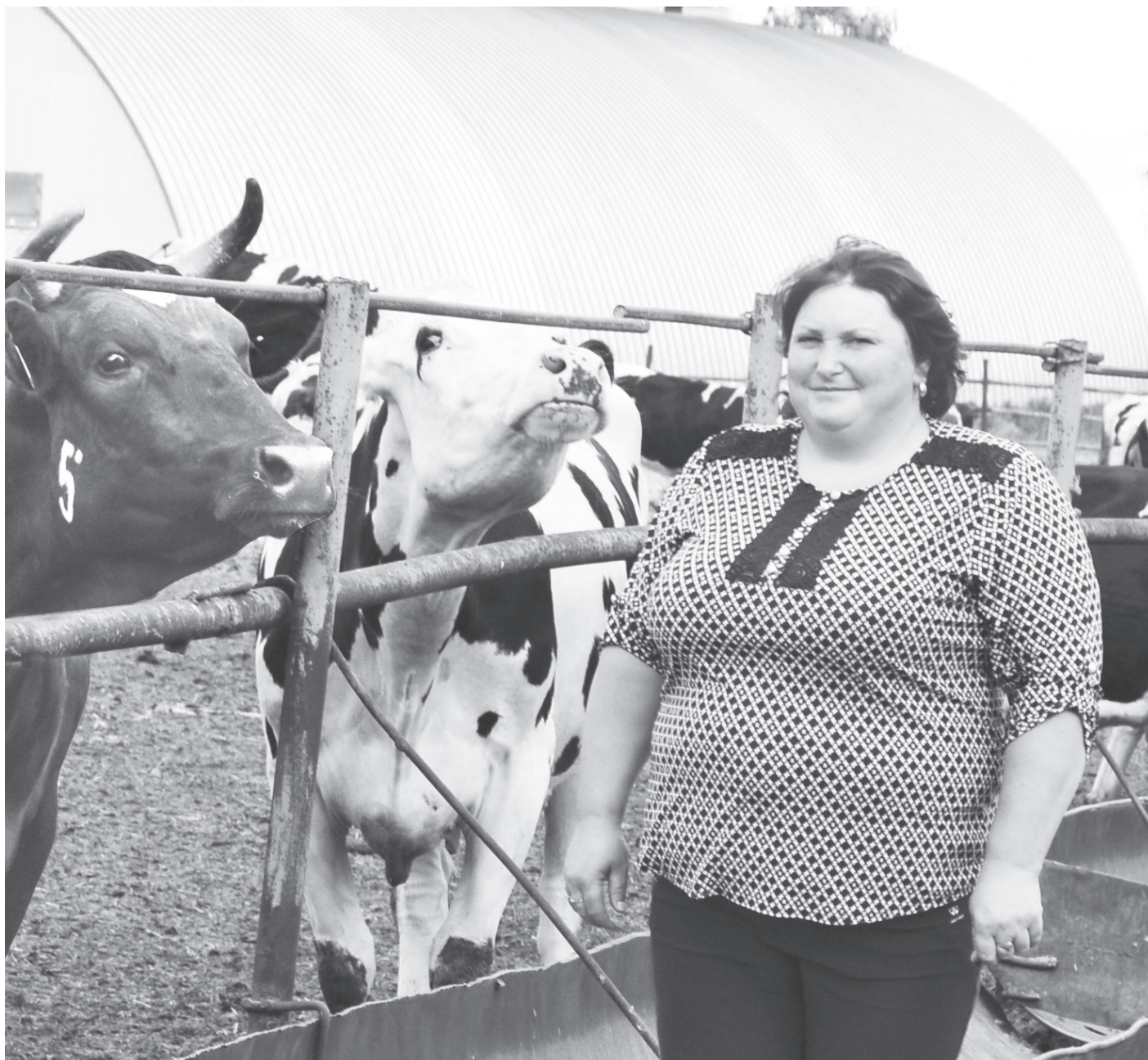
Татьяна Владимировна с большой любовью относится к своей работе.