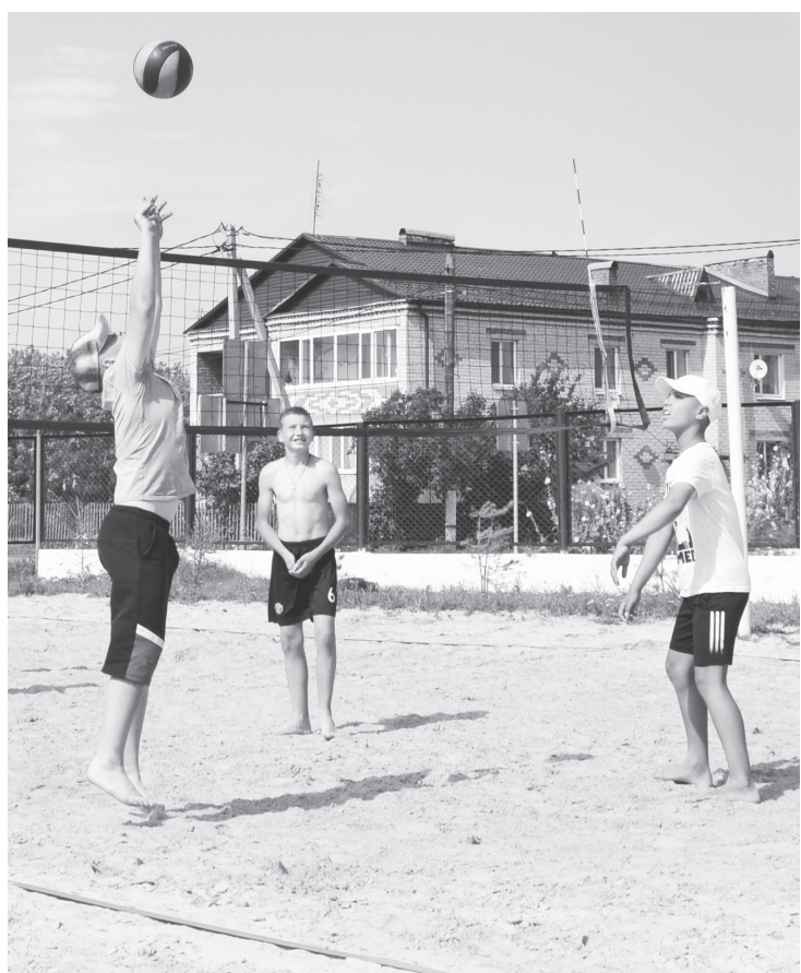
Игры на свежем воздухе и полезнее, и интереснее.

В райцентре для подростков есть много вариантов, чем заняться на летних каникулах. В Упоровской школе работает лагерь дневного пребывания, вечера можно провести на досуговых площадках при Доме культуры, детской библиотеке, «КЦСОН» и «ФиС». 21 июля начали свою работу ещё 3 лагеря дневного пребывания.