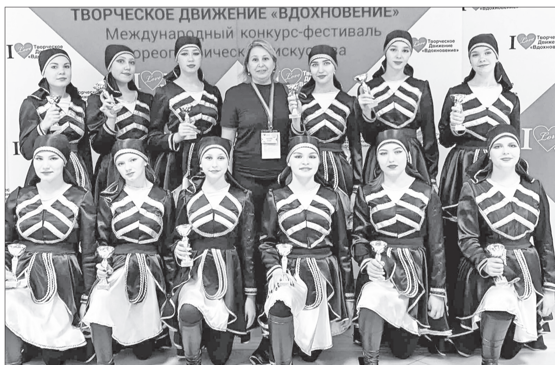
Очередная награда в копилке танцевального коллектива «Фламинго» Тюнёвского сельского Дома культуры.

Неповторимые костюмы, пластика, сценичность, исполнительское мастерство танцоров никого не остави-