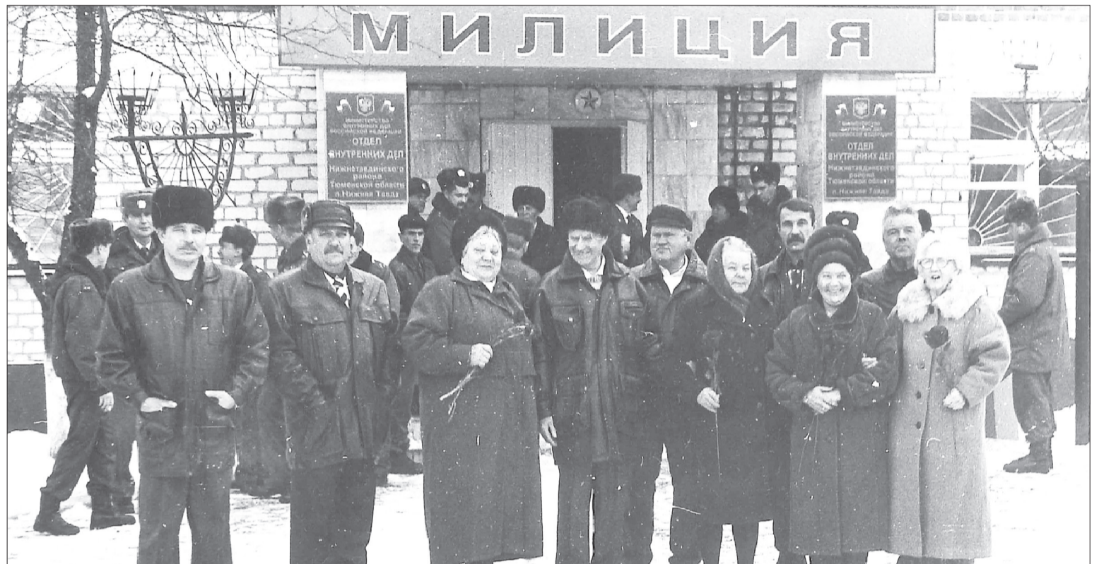
Ветераны отдела внутренних дел в День милиции, 10 ноября 2006 года.

Ведомость о населённых пунктах Тавдинской волости от 20 года прошлого века гласила, что площадь села Тавдинского составляла 148 квадратных вёрст. Стояло там 1038 домов, жили 5716 человек. Дороги были в удручающем состоянии. Восемь человек и одна лошадь состояли на доволь-