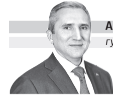
АЛЕКСАНДР МООР губернатор Тюменской области