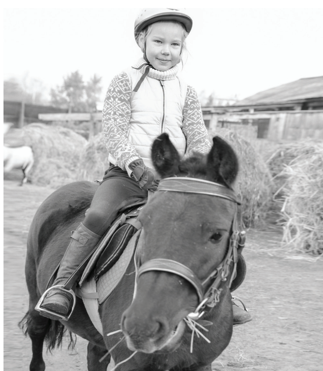
Инициатива реализуется в конном клубе «Кентавр», продлятся занятия до 31 декабря 2023 года.