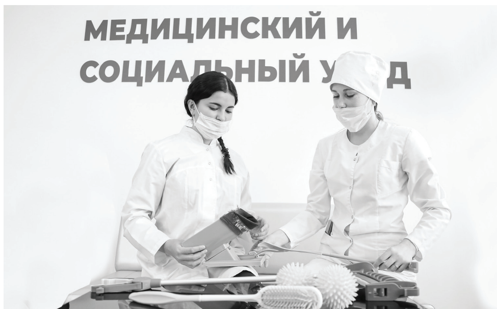
Уровень трудоустройства выпускников медколледжа – самый высокий среди образовательных учреждений такого профиля в регионе.

– Много заявок поступало через «Госуслуги» от выпускников школ из разных регионов: Свердловской области, Челябинской, есть анкеты даже из Хабаровского края, – отмечает Анна Александров-